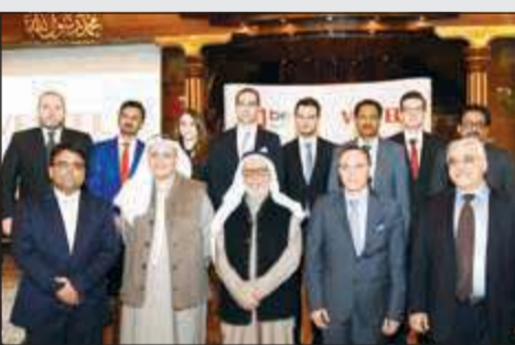
صورة جماعية لمديري شركتي اليوسفي وفيستل

فصيل المطوع لـ «الأنباء»: العالم تحظى دعايات الأزمة المالية.. والكويت لم تنفق 12 فلساً لتنمية الاقتصاد 28