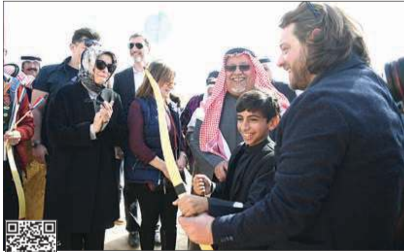
الشيخ علي الجراح والسفيرة التركية عائشة كويتاك خلال افتتاح جناح القرية التركية في قرية الشيخ صباح الأحمد التراثية (محمد هاشم)

قال وزير شؤون الديوان الأميري الشيخ علي الجراح إن قرية الشيخ صباح الأحمد التراثية تسهم في الحفاظ على التراث الخليجي الغني، فضلاً عن إدامة أواصر المحبة والأخوة بين شعوب المنطقة. جاء ذلك على هامش يوم مفتوح في القرية التراثية شهد افتتاح 4 أجنحة تراثية جديدة في قرية الشيخ صباح الأحمد التراثية، على هامش مهرجان الموروث الشعبي الخليجي، وهي أجنحة لكل من المملكة العربية السعودية ودولة قطر ومملكة البحرين وجمهورية تركيا، بحضور المستشار في الديوان الأميري محمد ضيف الله شرار، ومدير القرية التراثية سيف الشلاحي والسفير السعودي لدى الكويت الأمير سلطان بن سعد، والسفير القطري بندر العطية، والسفيرة التركية عائشة كويتاك. من جهته، عبر المستشار في الديوان الكويتي الأمير سلطان بن الله شرار، عن سعادته بافتتاح الأجنحة الجديدة، لافتاً إلى العمل بتوجيهات صاحب السمو الأمير الشيخ والإسلامي. التفاصيل ص 10 و 11