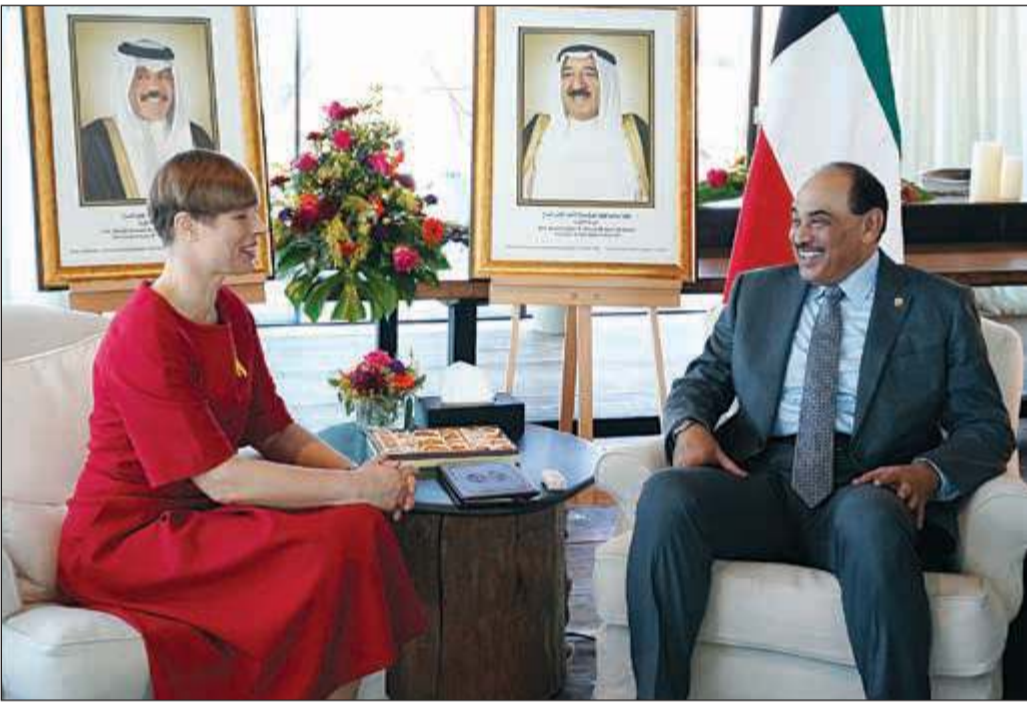
سمو رئيس مجلس الوزراء الشيخ صباح الخالد خلال لقائه رئيسة جمهورية إستونيا كريستي كاليويد على هامش مؤتمر الأمن في ميونيخ

ميونيخ - وكالات: هيمن «انكفاء» الدور الأميركي على أعمال مؤتمر الأمن في ميونيخ الذي انعقد أمس. وقد شهدت الدورة الـ 56 من المؤتمر مشاركة سمو رئيس مجلس الوزراء الشيخ صباح الخالد الذي ترأس وفد الكويت بحضور وزير الخارجية الشيخ د. أحمد ناصر المحمد. وقد استغل قادة أوروبا فعاليات مؤتمر الأمن في ميونيخ لتوجيه انتقادات حادة لتراجع نفوذ حليفهم الكبرى الولايات المتحدة، والدعوة لانتهاج سياسة الحوار مع عدوتهم اللدود روسيا. وعبر الرئيس الفرنسي إيمانويل ماكرون عن أسفه لـ «ضعف الغرب» الذي يواكبه «انكفاء نسبي» للولايات المتحدة، في تصريحات تناقض تأكيدات وزير الخارجية الأميركي مايك بومبيو. وقال ماكرون في مؤتمر الأمن بميونيخ إن «هناك ضعفا للغرب»، وأضاف: «هناك سياسة أميركية، تشمل نوعاً من الانكفاء ومراجعة لعلاقتها مع أوروبا»، داعياً القارة العجوز إلى أن تتولى تقرير مصيرها عبر «استراتيجية تحولها إلى قوة استراتيجية»، لكن بومبيو رفض الانتقادات، مؤكداً أنها «لا تعكس الواقع»، وقال إن «الغرب ينتصر ونحن نتصّر معاً». وأضاف: «يسرني أن أبلغكم بأن فكرة أن التحالف بين صفتي الأطلسي قد مات، مبالغ فيها إلى حد كبير». وتعزيزاً للفكرة، أعلن بومبيو أن بلاده ستتمول مشاريع في قطاع الطاقة تبلغ قيمتها مليار دولار في دول شرق ووسط أوروبا لتعزيز استقلالها في قطاع الطاقة في مواجهة روسيا. التفاصيل ص 32