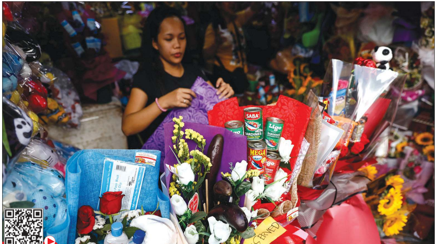
باقات الورد الحمراء مزينة بالكمامات الواقية والكحول المعقم عشية عيد الحب في الفلبين

كورونا المستجد يتوفي في اليابان، لكنه أكد أنه من غير الواضح ما إذا كان الفيروس هو السبب في وفاتها. وقال الوزير «العلاقة بين فيروس كورونا المستجد ووفاة المرأة لاتزال غير واضحة». مؤكدا «هذه أول وفاة لشخص مصاب بالفيروس». وأضاف أن المرأة التي تعيش في مقاطعة كاناغاوا، ظهرت عليها أعراض المرض في 22 يناير، ونقلت إلى المستشفى في 1 فبراير. وتابع «تم الاشتباه بإصابتها بفيروس كورونا المستجد.. ولذلك تم إجراء اختبار، وأكدت النتيجة إصابتها بالمرض بعد وفاتها». وفي اليابان أيضا، لا يزال الوضع متوترا على مدى السفينة السياحية «دايموند برينسس» التي فرض عليها الحجر الصحي قرب بوكوغاما (شرق)، إثر تشخيص 44 حالة جديدة ليرتفع عدد المصابين إلى 218 شخصا. ورست السفينة السياحية الأميركية «ويستردام» في كمبوديا حيث سيتمكن ركابها من النزول منها، بعد أن بقيت في عرض البحر لأكثر من عشرة أيام إثر رفض الموانئ الآسيوية السماح لها بالرسو خشية الوباء. وتقول الشركة المشغلة أنه لم يتم رصد أي إصابة على السفينة. وعلى غرار الصين، فرضت