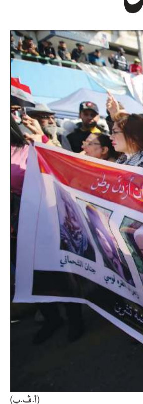
عراقيات يرقن لافتات مؤيدة للاحتجاجات الشعبية بساحة التحرير وسط بغداد أمس