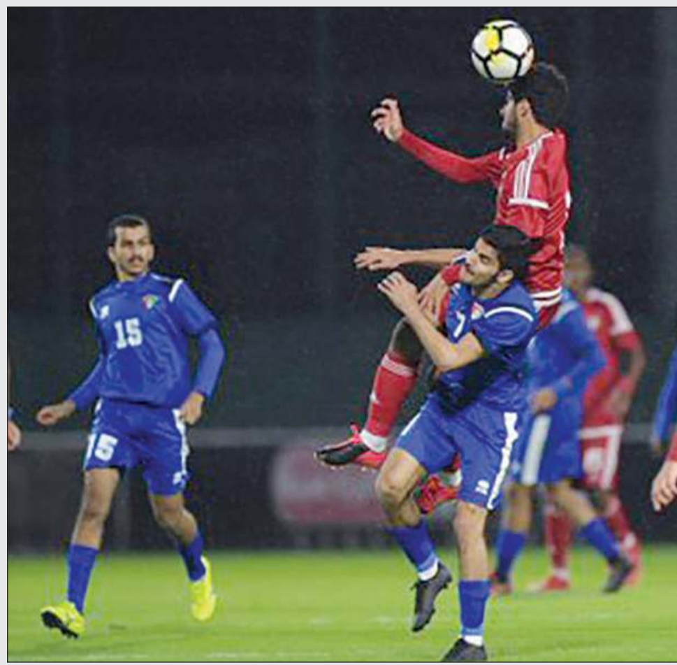
أزرق الشباب تفوق أداء ونتيجة على الإمارات