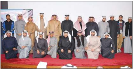
جانب من تكريم أبطال الرماية

قال رئيس نادي الرماية الكويتي دعيح العتيبي إن النادي قدم خطة إعداد طموحة للهيئة العامة للرياضة لإعداد رماة الكويت المتأهلين لدورة الألعاب الأولمبية المقبلة (طوكيو 2020) تتضمن إشراكهم بالعديد من البطولات الكبيرة في الفترة المقبلة.