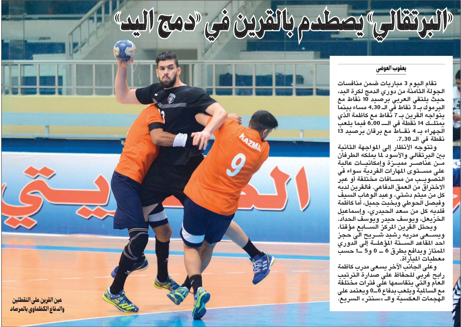
عين القرين على النقطتين والدفاع الكظماوي بالمرصاد

وعلى الجانب الآخر يسعى مدرب كاظمة رابع غربي للحفاظ على صدارة الترتيب العام والتي يتقاسمها على فترات مختلفة مع السالمية ويلعب بدفاع 6-0 ويعتمد على الهجمات العكسية والـ «سنتر» السريع.