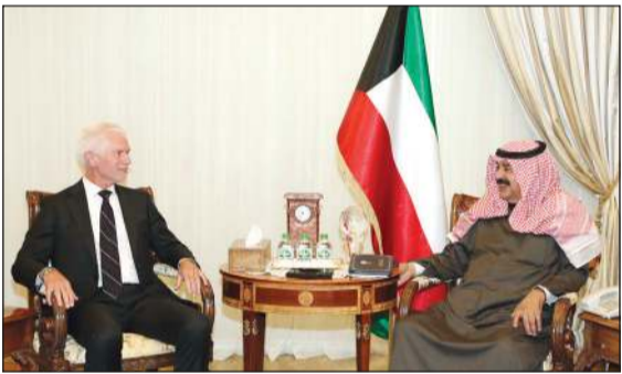
نائب وزير الخارجية خلال لقائه سفير ألمانيا لدى البلاد