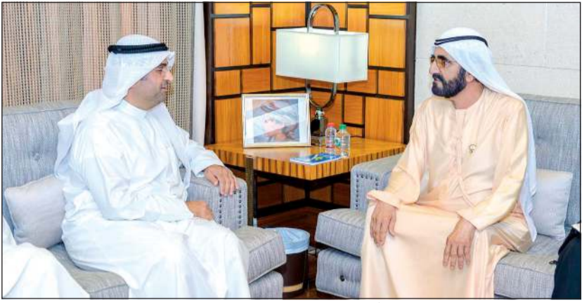
صاحب السمو الشيخ محمد بن راشد آل مكتوم خلال استقباله د. نايف الحجرف

وكان صاحب السمو الشيخ محمد بن زايد آل نهيان ولي عهد أبوظبي نائب القائد الأعلى للقوات المسلحة قد استقبل اسم الأول د. الحجرف بمناسبة بدء مهام عمله أميناً عاماً لمجلس التعاون. ورحب الشيخ محمد بن زايد خلال اللقاء الذي جرى في قصر الحصن بالحجرف وتمنى له التوفيق والنجاح في مهامه الجديدة من أجل تعزيز منظومة العمل الخليجي المشترك لمصلحة شعوب دول مجلس التعاون الخليجي وتطلعاتها نحو التنمية والتقدم والرخاء. وفي سياق متصل، استقبل سمو الشيخ عبدالله بن زايد آل نهيان وزير الخارجية والتعاون الدولي أمس د. نايف الحجرف، حيث جرى خلال اللقاء بحث عدد من القضايا ذات الاهتمام المشترك وسبل تعزيز منظومة العمل الخليجي المشترك.