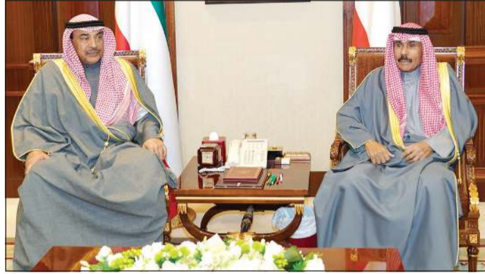
سمو ولي العهد الشيخ نواف الأحمد مستقبلاً رئيس مجلس الوزراء

أبو ظبي - وام: استقبل صاحب السمو الشيخ محمد بن راشد آل مكتوم نائب رئيس دولة الإمارات رئيس مجلس الوزراء حاكم دبي في دبي أمس د. نايف الحجرف الأمين العام الجديد لمجلس التعاون لدول الخليج العربية بمناسبة تسلمه مهام منصبه. وقالت وكالة انباء الإمارات الرسمية «وام» إن الشيخ محمد بن راشد رحب بالحجرف، متمنياً له النجاح والساد في أداء مهامه والعمل الجاد والمخلص لما فيه خدمة ومصصلحة الدول الأعضاء وشعوبها مجتمعة. وأكد الشيخ محمد بن راشد أثناء تجاوزه وأمين عام المجلس أطراف الحديث حرص قيادات الدول الأعضاء على دعم وتعزيز مسيرة مجلس التعاون على مختلف الصعد وفي شتى الميادين، وذلك من خلال تنفيذ القرارات التي صدرت عن قممهم السابقة. من جهته، أعرب د. نايف الحجرف عن اعتزازه بتسلمه منصبه الجديد كي يتمكن من خدمة دول المجلس وشعوبها ومصالحها العليا وترجمة التوجيهات السديدة لأصحاب الجلالة والسمو قادة الدول الأعضاء إلى أفعال.