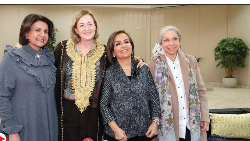
الأمين العام لوزارة الخارجية الهولندية يوكا براندت مع لولوة الملا والحضور (زين غلام)

وردا على سؤال عن انطباعات من المرأة الكويتية، أبدت إعجابها بنشاط وحماس أعضاء الجمعية الثقافية الخارجية التي تقوم بها الجمعية. بدورها، أشاد سفير مملكة هولندا لدى البلاد فرانس بوتاييت