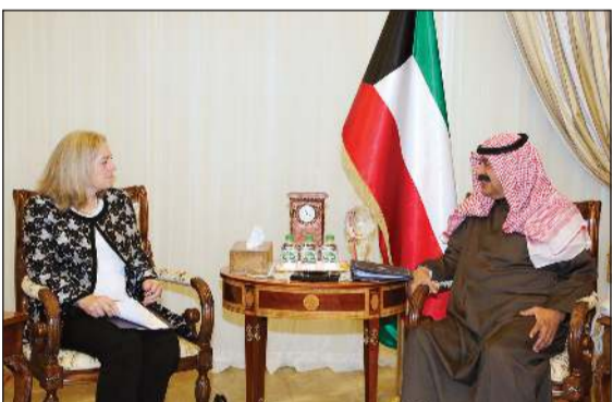
خالد الجارالله خلال استقباله السفيرة الأميركية لدى البلاد

اجتمع نائب وزير الخارجية خالد الجارالله مع سفيرة الولايات المتحدة الأميركية لدى الكويت السفيرة إينا رامانوسكي بمناسبة تسلم مهام عملها لدى الكويت، وتم خلال اللقاء استعراض عدد من أوجه العلاقات الثنائية بين البلدين الصديقين إضافة إلى تطورات الأوضاع على الساحتين الإقليمية والدولية. كما اجتمع نائب وزير الخارجية خالد الجارالله مع سفير جمهورية ألمانيا الاتحادية لدى الكويت السفير ستيفان موبس بمناسبة تسلم مهام عمله لدى الكويت، وتم خلال اللقاء استعراض عدد من أوجه العلاقات الثنائية بين البلدين الصديقين إضافة إلى تطورات الأوضاع على الساحتين الإقليمية والدولية. واجتمع نائب وزير الخارجية خالد الجارالله مع سفير مملكة هولندا يوكا برانتست التي تقوم بزيارة للبلاد والوفد المرافق لها حيث