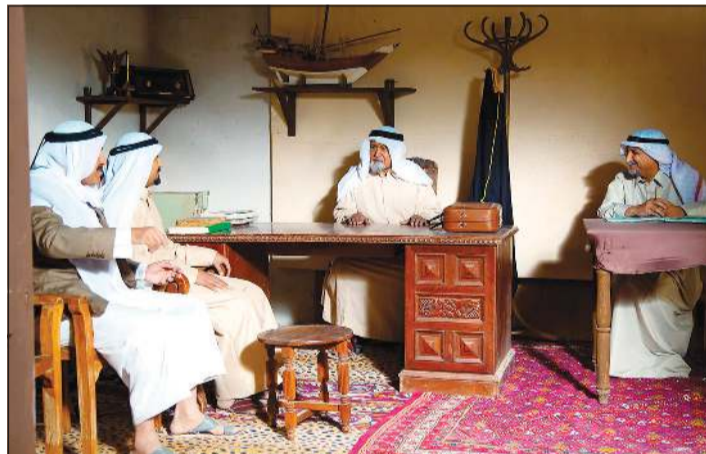
مشهد من «رحى الأيام»