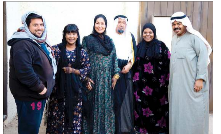
المخرج حمد النوري مع عدد من النجوم المشاركين في المسلسل

المرضية للمشاهدين، كما وجه الشكر الى المسؤولين وزارة الاعلام لتشجيعهم ودعمهم لمثل هذه الأعمال التي تعرف الاجيال الجديدة بعادات وتقاليد الآباء والأجداد، متمنيا أن ينال المسلسل اعجاب كل من يشاهده على شاشة تلفزيون الكويت. ولم يخف النوري استعدادة الجيد للتجربة الجديدة، وقال: النص