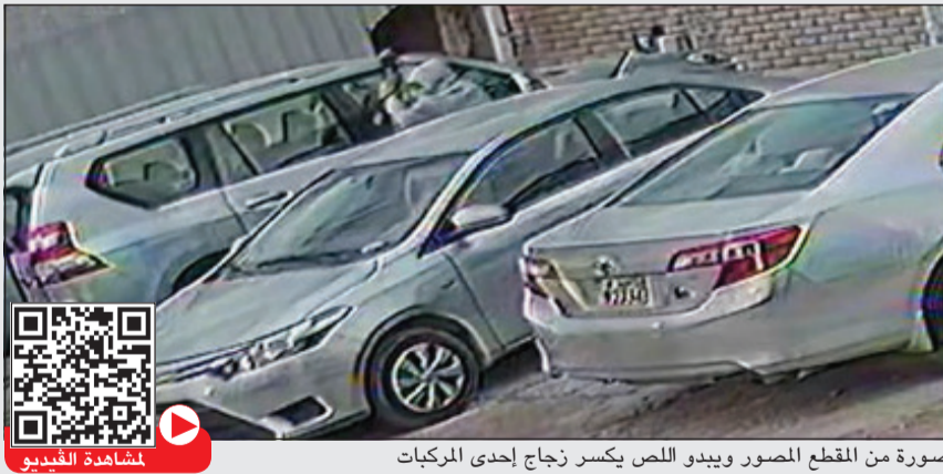
صورة من المقطع المصور ويبدو اللص يكسر زجاج إحدى المركبات