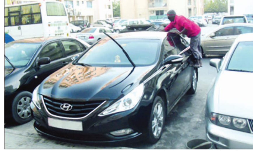
صورة أرشيفية لوافد يقوم بغسيل السيارات

الأوتة الأخيرة وردت عدة بلاغات في عدد من المناطق السكنية، وكشفت البلاغات عن تعرض مركبات للسرقة سواء عن طريق الكسر أو سرقة المركبات كاملة عقب تركها مقابل المنازل في وضعية تشغيل وصعود أصحابها لدقائق إلى سكنهم. وأضاف المصدر: تم إعداد خطة عمل للإيقاع بالجاني في المناطق التي تمت فيها السرقات، حيث جرى الإيعاز لعدد من رجال