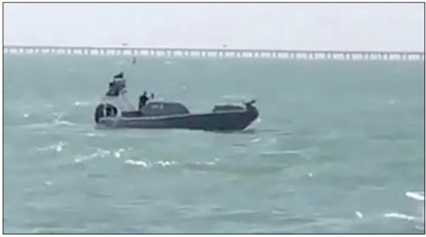
رجال خفر السواحل أثناء البحث

ويتواجد في النقعة للأطمئنان على جميع الصيادين، ومزال البحث جارياً، أملاً العثور على الصياد المفقود بأسرع وقت ممكن. وفي السياق ذاته، واصلت دوريات خفر السواحل والإنقاذ البحري التابع للإدارة العامة للإطفاء تمشيط منطقة نقعة الشمالان وذلك في محاولة للعثور على شخص فقد خلال رحلة حداق في البحر. واستناداً إلى مصدر أمني، فإن عمليات الداخلية أبلغت صباح أمس عن انقلاب طراد صيد على مقربة من النقعة، وعلى الفور سارع رجال خفر السواحل ليتم انتشال أحد الشخصين، فيما لا يزال الثاني مفقوداً حتى إعداد الخبر للنشر. هذا، ولم تعرف أسباب الحادث، لكن يرجح أن تكون الأحوال الجوية سبباً في الحادث.