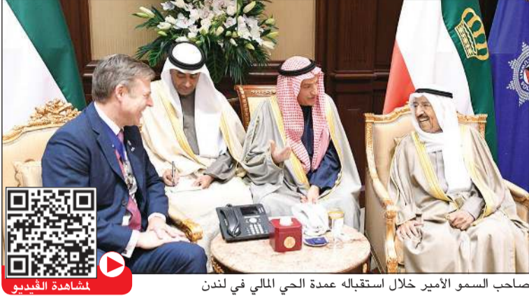
صاحب السمو الأمير خلال استقباله عمدة الحي المالي في لندن