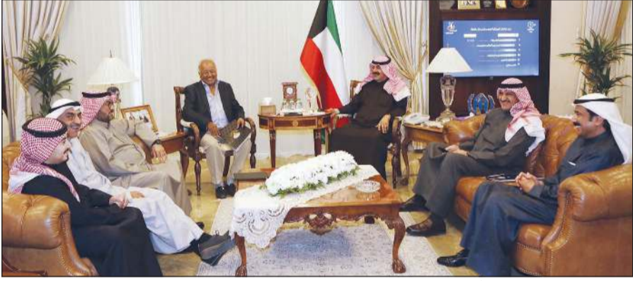
خالد الجارالله خلال اجتماع أعضاء اللجنة لمؤتمر التعليم بالصومال

عقدت اللجنة المكلفة بالإعداد لمؤتمر دعم التعليم في الصومال، والذي سيعقد في الكويت خلال العام الحالي، اجتماعاً برئاسة نائب وزير الخارجية رئيس اللجنة خالد الجارالله، وتم خلال اللقاء استعراض الاستعدادات الجارية لعقد المؤتمر بحضور أعضاء اللجنة.