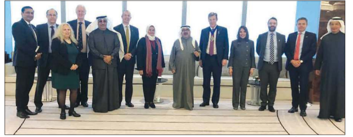
الشيخ ناصر صباح الأحمد يتوسط عمدة الحي المالي لمدينة لندن لورد ويليام راسل والوفد المرافق له

أقام الشيخ ناصر صباح الأحمد مأدبة غداء على شرف عمدة الحي المالي لمدينة لندن لورد ويليام راسل والوفد المرافق له بمناسبة زيارته الكويت بحضور السفير البريطاني وأعضاء المجلس الأعلى للتخطيط.