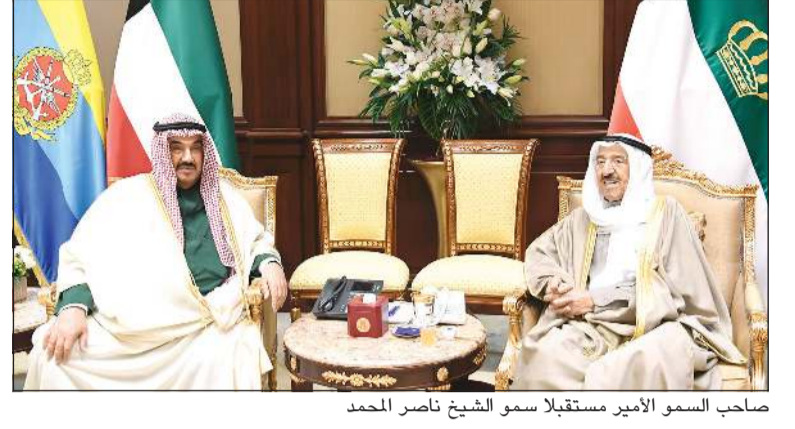
صاحب السمو الأمير مستقبلاً سمو الشيخ ناصر محمد

استقبل صاحب السمو الأمير الشيخ صباح الأحمد بقصر بيان صباح امس سمو الشيخ ناصر المحمد. كما استقبل سموه وزير المالية مريم العقيل وعمدة الحي المالي لمدينة لندن لورد ويليام راسل والوفد المرافق، وذلك بمناسبة زيارته للبلاد. واستقبل سموه بقصر بيان صباح امس رئيس مجلس إدارة بنك الكويت الوطني ناصر مساعد الساير والرئيس التنفيذي للمجموعة عصام محمد الصفرو، حيث قدما لسموه دعوة لحضور حفل افتتاح المبنى الجديد لبنك الكويت الوطني. حضر المقابلة نائب وزير شؤون الديوان الأميري الشيخ