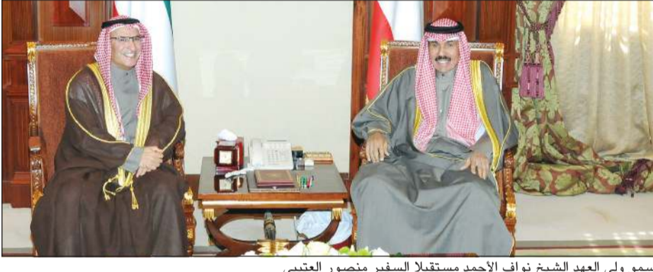
استقبل سمو ولي العهد الشيخ نواف الأحمد بقصر بيان صباح امس سمو الشيخ ناصر المحمد. كما استقبل سمو ولي العهد الشيخ نواف الأحمد مندوبنا لدى الأمم المتحدة السفير منصور العتيبي.