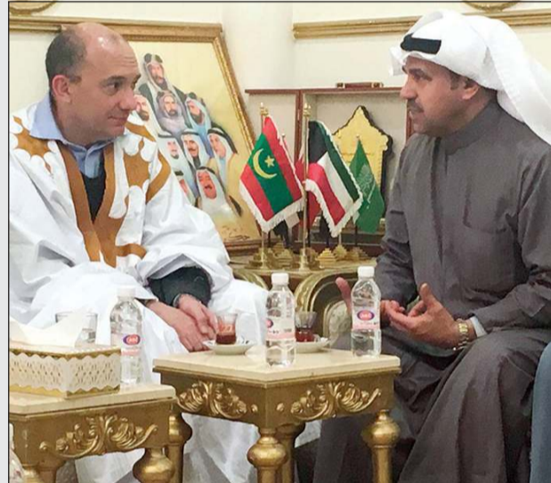
فهد الشليمي مستقبلاً سفير موريتانيا محمد ولد داداه

استقبل المحلل السياسي فهد الشليمي في ديوانه بمنطقة الأندلس سفير جمهورية موريتانيا الإسلامية محمد ولد داداه. ورحب الشليمي بزيارة السفير الموريتاني والوفد المرافق له، مؤكداً سعادته بتلك الزيارة الودية التي قام بها السفير لأحد دواوين الكويت، مشيداً بالعلاقات الطيبة والتاريخية التي تربط البلدين الكويت وموريتانيا. بدوره، أثنى السفير الموريتاني على عادات وتقاليد الشعب الكويتي والانسجام التام بين جميع مكوناته.