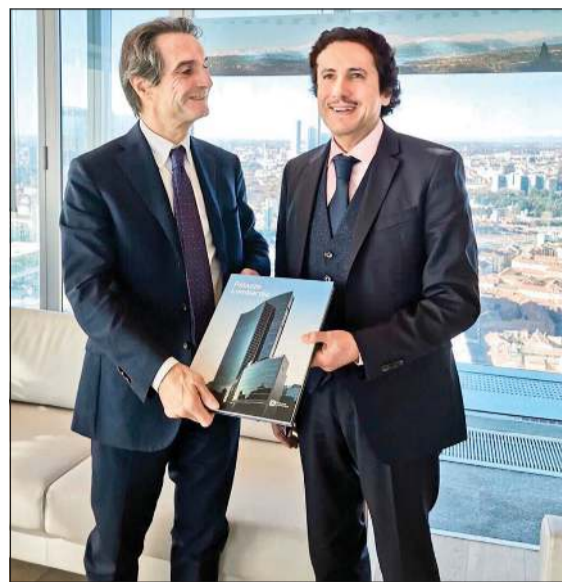
حاكم إقليم لومبارديا أتيليو فونتانا خلال لقائه السفير الشيخ عزام الصباح

مصاف الاقتصادات العالمية المتقدمة. من جانبه، رحب السفير الشيخ عزام الصباح برغبة إقليم لومبارديا أكثر الأقاليم الأوروبية تقدماً على المستوى الاقتصادي والصناعي والتكنولوجي والمالي في المساهمة كشريك في تحقيق أهداف رؤية كويت 2035 ما يسمح بالاستفادة من نموجها التنموي المتفوق. وأكد الشيخ عزام الصباح ان تعزيز أوجه التعاون بين ممثلي القطاع الخاص والأعمال والشركات الكويتية، لاسيما التي يقودها شباب مع قطاع الأعمال في لومبارديا يندرج ضمن سياسات الدولة لاستيعاب الخبرات والتكنولوجيات العالمية والتميزة وتوطينها ويعكس الحرص المتبادل على تطوير علاقات الصداقة والتعاون بين الكويت وإيطاليا.