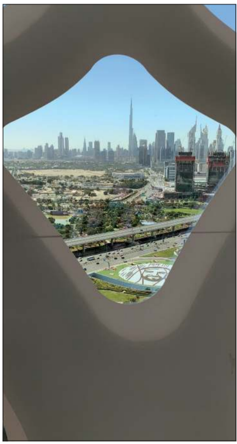
صورة لدبي الحديثة من بربواز دبي