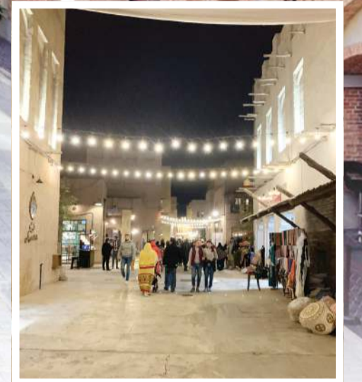
الغزات الإماراتي في سوق السيف

الدورة الـ 25 لمهرجان التسوق هي الأكبر في تاريخه بعروض ترويجية مذهلة وجوائز ضخمة وفعاليات وتجارب استثنائية