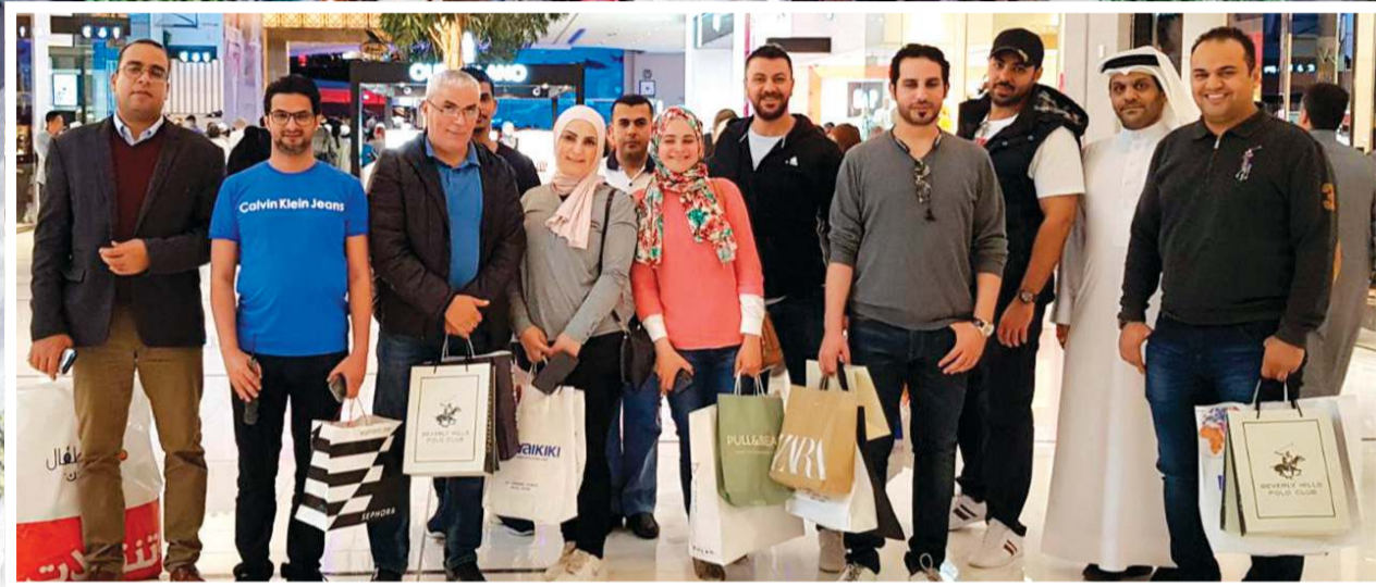
أعضاء الوفد خلال جولة في مهرجان التسوق