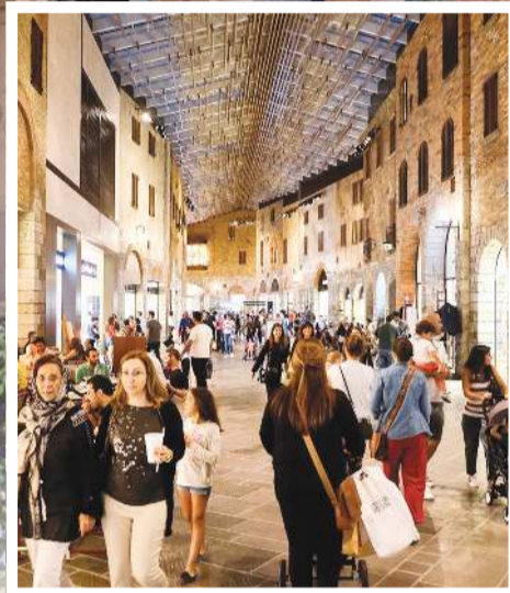
أوت لت فيلج