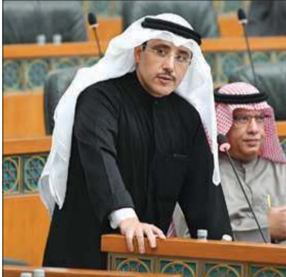
الشيخ د.أحمد الناصر