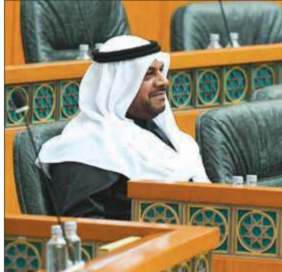
الشيخ أحمد المنصور