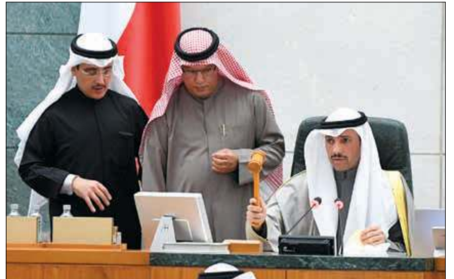
رئيس مجلس الأمة مرزوق الغانم ومبارك الحريص والشيخ د. أحمد الناصر

يرفر فر في عواصم عربية. لو كانت هذه الدول مع نقل السفارة سحبت سفراءها لما تجرت أميركا على ذلك، وأصبح الكثير من الدول العربية ما هي إلا منفذاً لسياسة رئيسهم في البيت الأبيض. كل الأمل في الشعوب العربية التي تتجاوب مع القضايا العربية مثل الشعب الفلسطيني العظيم الذي يواجه الصلف الإسرائيلي والغطرسة الاسرائيلية، الأمل في المقاومة الشعبية، والوقوف امام هذه المؤامرة.