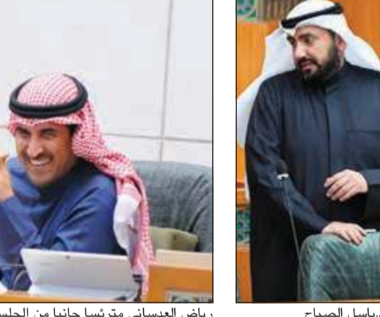
الشيخ د. باسل الصباح