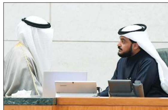
رئيس مجلس الأمة مرزوق الغانم و.محمد الحويلة