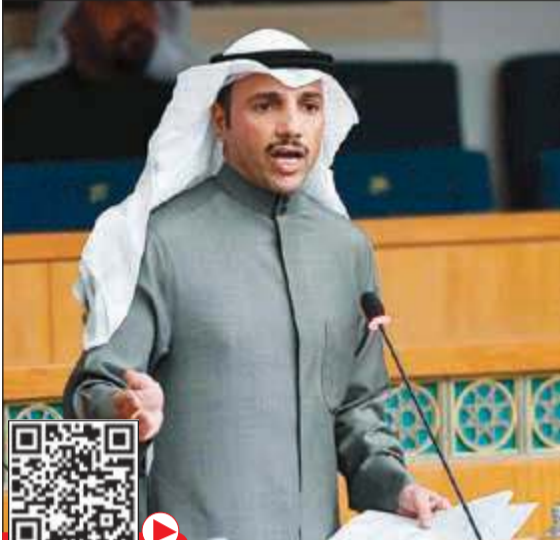
الرئيس مرزوق الغانم متحدثا من مقاعد النواب