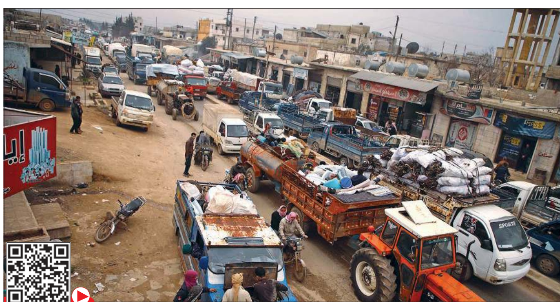
عشرات الآليات تحمل نازحين سوريين ومقتنياتهم الضرورية ينتظرون العبور في بلدة حزانو بريف ادلب

جراء التصعيد العسكري للقوات السورية وحليفها روسيا، في واحدة من أكبر موجات النزوح منذ بدء النزاع الذي يقتر من اتمام عامه التاسع، وقال المتحدث الإقليمي باسم مكتب تنسيق الشؤون الإنسانية التابع للأمم المتحدة ديفيد سوانسون لوكالة فرانس برس «منذ الأول من ديسمبر، نحو 520 ألف شخص نزحوا من منازلهم، 80٪ منهم من النساء والأطفال». وأوضح أن «أعمال العنف شبه اليومية لفترات طويلة أدت إلى معاناة مئات الآلاف من الناس، الذين يعيشون في المنطقة، بشكل لا مبرر له». وفي قرية حزانو الواقعة شمال مدينة إدلب، رصدت وكالة فرانس برس عشرات السيارات والشاحنات الصغيرة التي تقل نازحين مع مقتنياتهم من أوان منزلية وخزانات مياه وأدوات كهربائية وفرش وأغطية شتوية وحتى محاصيل زراعية وأخشاب.