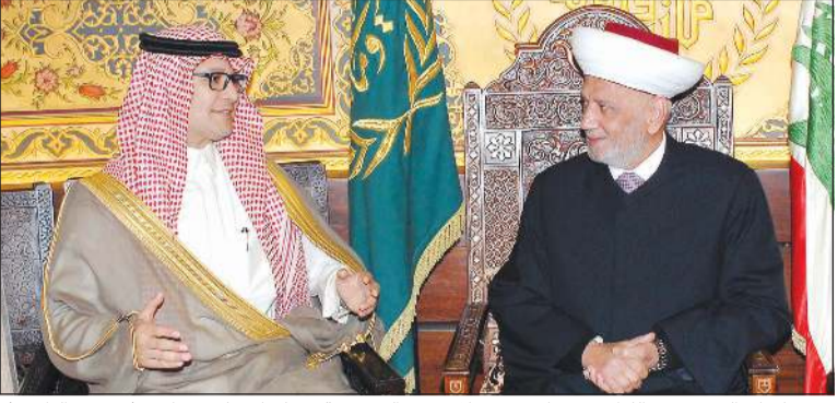
مفتي لبنان الشيخ عبد اللطيف دريان مستقبلا سفير السعودية في لبنان وليد بخاري (محمود الطويل)

دولته المستقلة وعاصمتها القدس الشرقية. من جهته، رأى المفتي دريان ان المملكة العربية السعودية كانت وستبقى ذخرا للامة العربية والاسلامية في مساعدتها ودعمها ووقوفها الى جانب قضايا العرب والمسلمين في كل مكان وخاصة في الازمات وابتهاجا السياسة الحكيمه المعتدلة التي تقوم بها في مساعيها التوفيقية والتوحيدية في توطيد التضامن العربي والتعاون الاسلامي الذي تنشده جميع الشعوب العربية، واعتبر ان لبنان رغم ازماته وخاصة منها الاقتصادية والمعيشية ما زال شعبه مصمما على العيش الكريم والحياة ضمن اطار مؤسسات الدولة الحاضرة لجميع اللبنانيين. وجدد سماحته موقفه الرافض لصفقة القرن المشيئة التي تحاول امريكا تمريرها رغم معارضة الوطن العربي والعالم الاسلامي وكل الشعوب الحرة بانزاعها للحقوق التاريخية للشعب الفلسطيني الصامد والصابر والمجاهد لقضيته التي هي قضية كل مسلم وكل عربي بل وكل انسان حر.