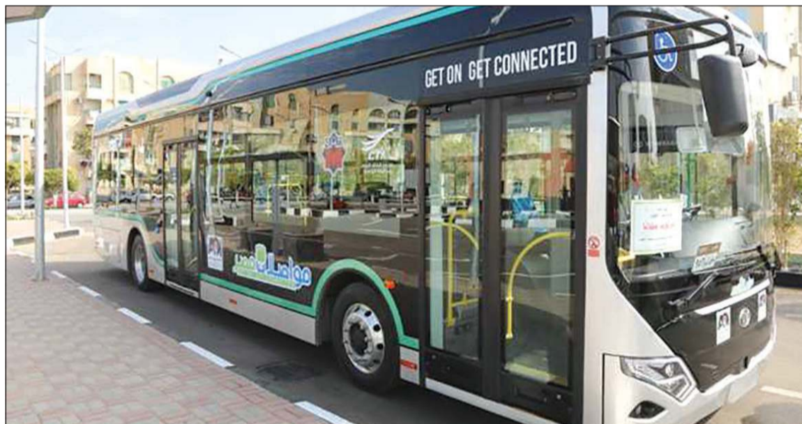
الأتوبيس الكهربائي الجديد

وتأتي منظومة الأتوبيسات الكهربائية الذكية في إطار تفعيل مذكرة التفاهم التي وقعتها الهيئة العربية للتصنيع في شهر مايو 2019 لتشكيل تحالف مع شركة «شنغهاي وانكسيانج»،