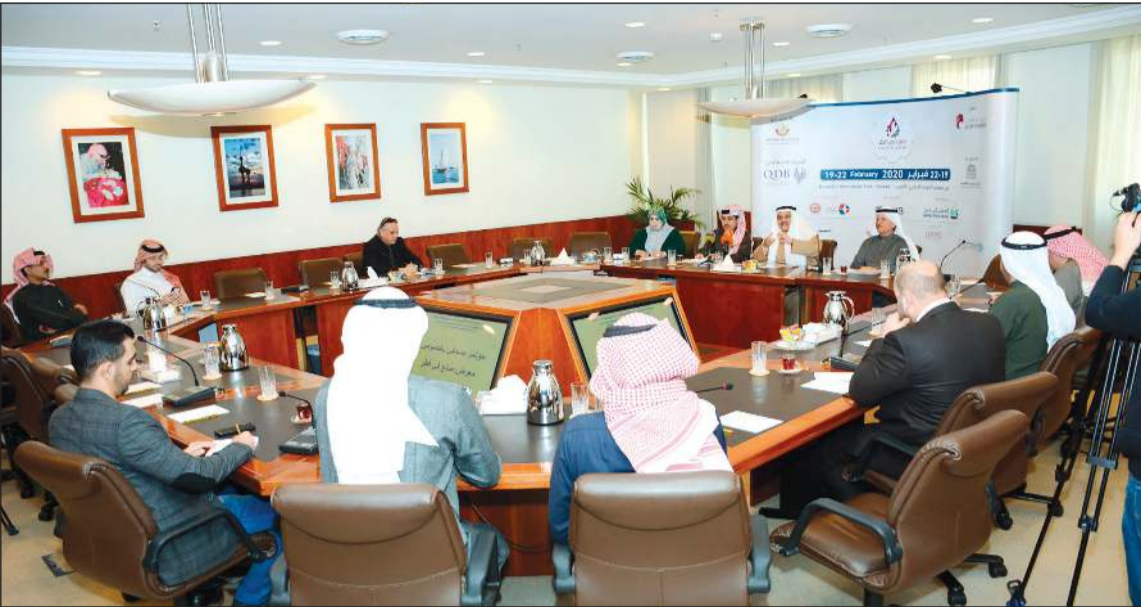
جانب من اجتماع الوفدين الكويتي والقطري في غرفة التجارة لتنظيم «معرض صنع في قطر 2020».

■ الرباح: المعرض فرصة لرجال الأعمال الكويتيين للاطلاع على الصناعة القطرية ■ الشرقي: المعرض يفتح الباب أمام دخول الشركات القطرية للسوق الكويتي