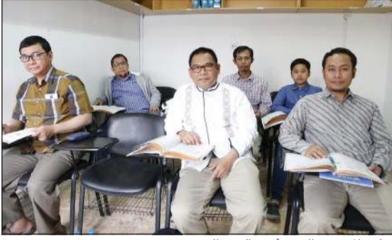
تعليم المهتمين الجدد أمور الدين الحنيف