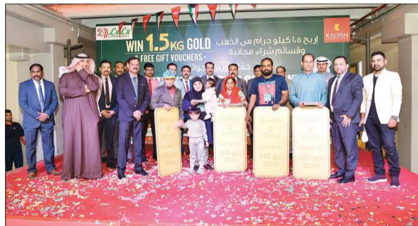
جانب من توزيع الجوائز

في لولو هايبر ماركيت الكويت ومجوهرات كاليان في الكويت. وخلال العرض الترويجي «تسوق واربح في لولو» كان يحق لكل متسوق بقيمة لا تقل عن 10 دنانير من أي من العروض كبيرة جدا مع إجمالي 1,5 كيلوغرام من الذهب المعروض كجوائز من مجوهرات كاليان.