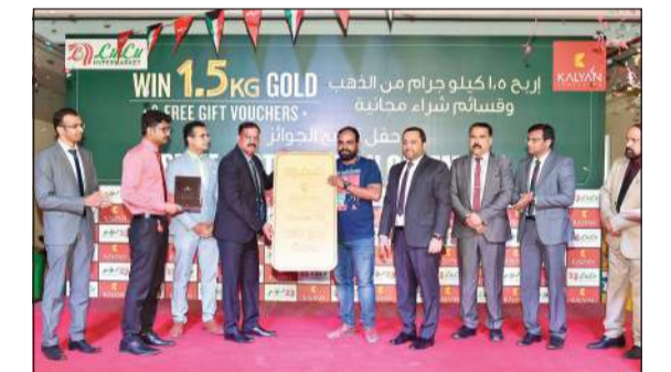
أحد الفائزين يتسلم جائزته