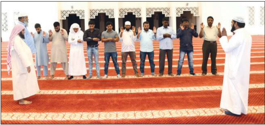
تعليم المهتمين الصلاة

وتابع: كذلك كان للجنة التعريف بالإسلام اهتمام كبير بنشر القرآن الكريم، وتعليم العلم الشرعي، حيث وزعت أكثر من 1200 ترجمة لمعاني القرآن الكريم، وأقامت 765 دورة شرعية استفاد منها أكثر من 7600 مستفيد، وتعلم المهتمون خلال هذه الدورات الطهارة، والوضوء، والصلاة، والسيرة، والحديث إلى جانب تحفيظهم ما تيسر من القرآن الكريم. وأضاف الثويني: حرصت اللجنة على تطوير دعواتها حيث أقامت 12 دورة استفاد منها أكثر من 75