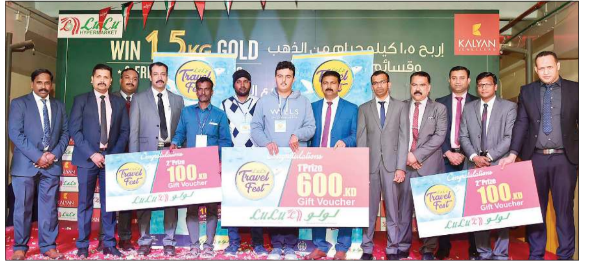
لمتة متكررة خلال توزيع الجوائز

في لولو هايبر ماركيت الكويت ومجوهرات كاليان في الكويت. وخلال العرض الترويجي «تسوق واربح في لولو» كان يحق لكل متسوق بقيمة لا تقل عن 10 دنانير من أي من العروض كبيرة جدا مع إجمالي 1,5 كيلوغرام من الذهب المعروض كجوائز من مجوهرات كاليان.