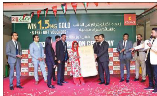
جائزة لإحدى الفائزات