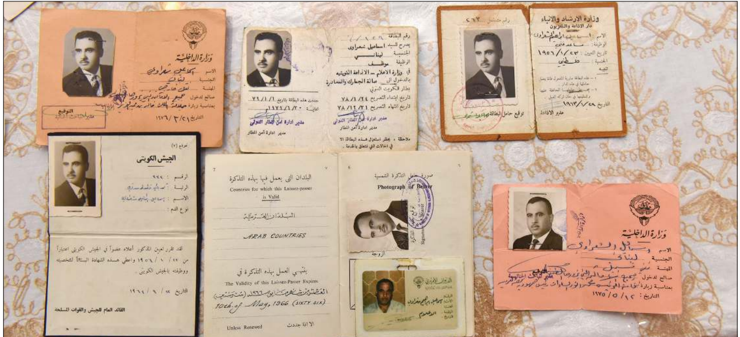
بعض أوراق أبو شوقي القديمة التي احتفظ بها كذكريات