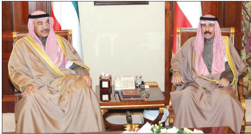
سمو ولي العهد الشيخ نواف الأحمد خلال لقائه سمو رئيس الوزراء الشيخ صباح الخالد

استقبل سمو ولي العهد الشيخ نواف الأحمد بقصر بيان صباح أمس رئيس مجلس الأمة مرزوق الغانم. واستقبل سمو ولي العهد بقصر بيان صباح أمس سمو الشيخ جابر المبارك، كما استقبل سمو ولي العهد بقصر بيان صباح أمس سمو رئيس الوزراء الشيخ صباح الخالد.