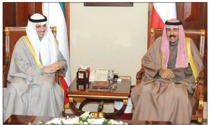
سمو ولي العهد الشيخ نواف الأحمد مستقبلاً رئيس مجلس الأمة مرزوق الغانم