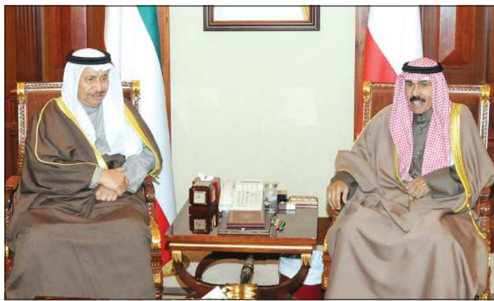
سمو ولي العهد خلال استقباله سمو الشيخ جابر المبارك

أعلنت الهيئة العامة لمكافحة الفساد «نزاهة» أمس إحالة عدد من المسؤولين في شركة نفط الكويت وآخرين إلى النيابة العامة على خلفية بلاغ تقدمت به الشركة عن شبهات جرائم فساد حملتها خساتر مالية ناتجة عن إهمال وتقاعس المسؤولين عن إدارة المشاريع في منطقة شمال الكويت. وقال المتحدث الرسمي للهيئة الأمين العام المساعد لكشف الفساد والتحقيق د. محمد بوزير في تصريح صحافي إن البلاغ تضمن نتائج لجنة تحقيق لدراسة وفحص الملاحظات الواردة في تقرير ديوان المحاسبة للسنة المالية 2017/2018 بشأن عقود ومشروعات خطوط تدفق أنابيب النفط الخام في مناطق شمال الكويت. ولفت بوزير إلى ما انتهى إليه التقرير آنف الذكر من توافر شبهات جرائم فساد قدرت بمبلغ 4.683 ملايين دينار. وأضاف أن البين من التحقيقات وجمع الاستدالات وسماع أقايات الشهود التي أجريت بمعرفة قطاع كشف الفساد والتحقيق