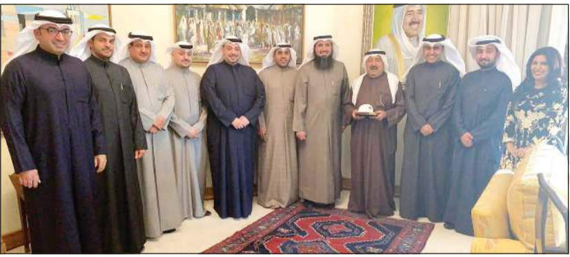
الشيخ ناصر صباح الأحمد مستقبلاً رئيس وأعضاء جمعية المهندسين