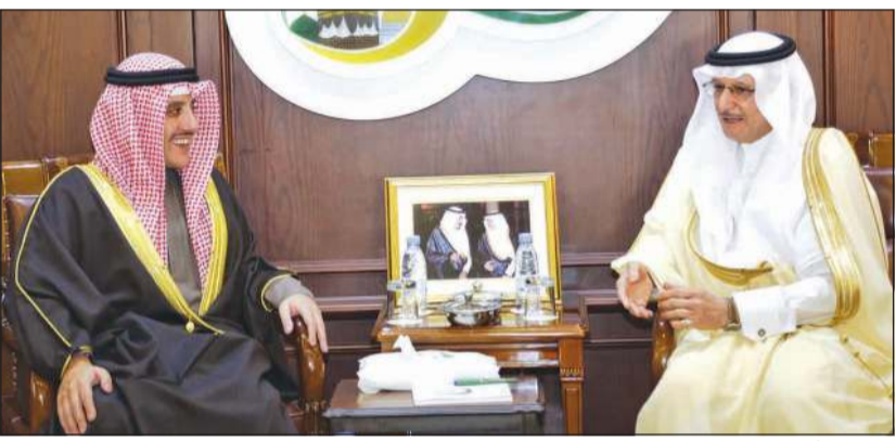
الشيخ د. أحمد الناصر خلال اللقاء مع د. يوسف العثيمين

استعرض الأمين العام معه جدول أعمال الاجتماع والاستعدادات والتحضيرات القائمة له. حضر اللقاء الوزير المفوض ناصر الهين مساعد وزير الخارجية لشؤون المنظمات الدولية وهاشم الوزير المفوض وائل العززي قنصلنا العام في جدة والمندوب الدائم للكويت لدى منظمة التعاون الإسلامي.