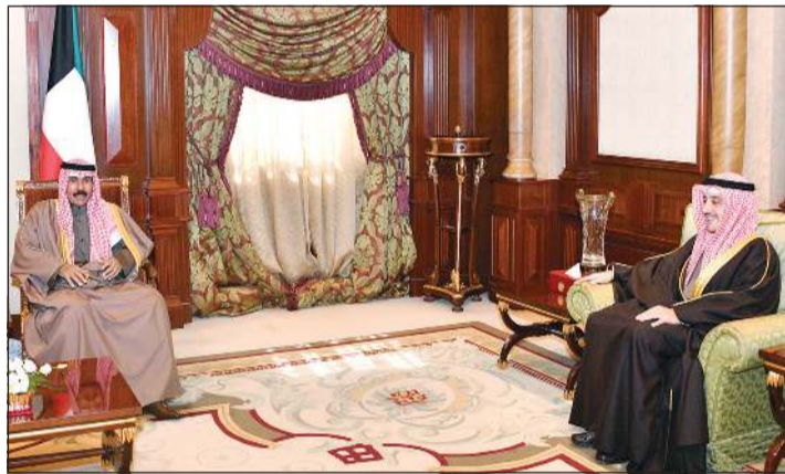
.. وسموه خلال استقباله الشيخ د. أحمد ناصر المحمد

واستقبل سمو ولي العهد بقصر بيان صباح أمس نائب رئيس مجلس الوزراء ووزير الدفاع الشيخ أحمد المنصور. كما استقبل سموه بقصر بيان أمس نائب رئيس مجلس الوزراء ووزير الداخلية ووزير الدولة لشؤون مجلس الوزراء أنس الصالح. واستقبل سمو ولي العهد بقصر بيان أمس وزير الخارجية الشيخ د. أحمد ناصر المحمد. كما استقبل سموه بقصر بيان أمس وزير النفط ووزير الكهرباء والماء د. خالد الفاضل، حيث قدم لسموه وكيل وزارة النفط الشيخ د. نمر فهد المالك وذلك بمناسبة تعيينه في منصبه الجديد.