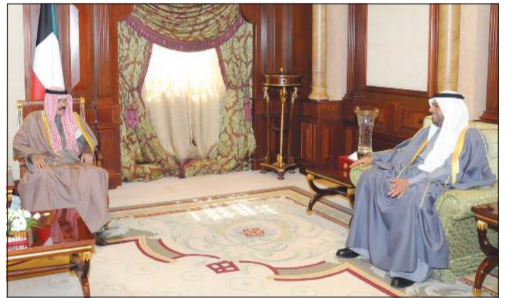
سمو ولي العهد مستقبلاً الشيخ أحمد المنصور