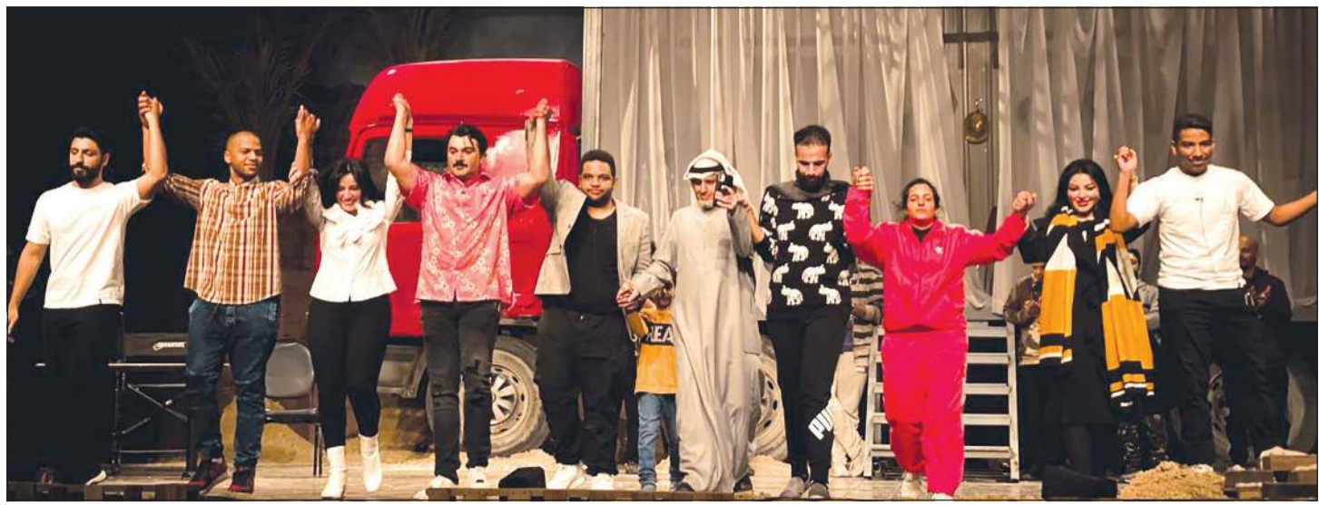
نجوم «كومبارس»... وحية للجمهور