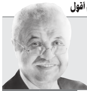
د.طلال أبو غزالة