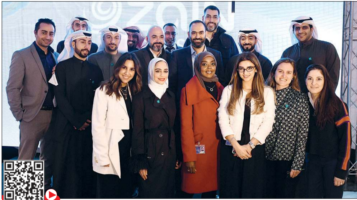
فريق «زين أعمال» المشرف على التطبيق خلال الحفل