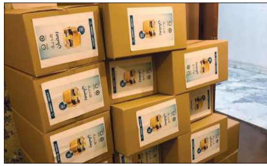
توزيع سلال غذائية