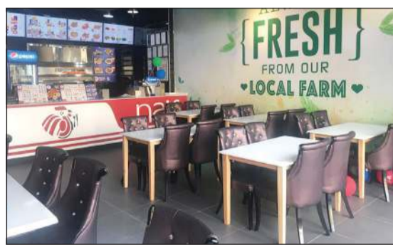
مطعم غرب أبو فطيرة

5 فروع بمواقع استراتيجية مهمة وتشمل المناطق الحيوية والمجمعات التجارية، وذلك لبلوغ هدفها الأسمى بجعل تجربة نايف متاحة للجميع في كل مكان وفي أي وقت. وبدأت قصة نجاح سلسلة مطاعم دجاج نايف منذ 1985م عند افتتاح أول فروعها في منطقة شرق وواصلت نجاحها لتصبح من أبرز العلامات التجارية في مجال المطاعم، حيث تقدم الجودة والمذاق والسعر بمعايير عالمية وتنافسية. وسلسلة مطاعم دجاج نايف الكويتية الحائزة على شهادة الأيزو والهاسب للمواصفات العالمية، تتميز بتقديم الدجاج الكويتي الحلال الملتزم من مزارعها في الكويت وهو شعارها الذي تتفخر به «دجاجنا من مزارعنا».