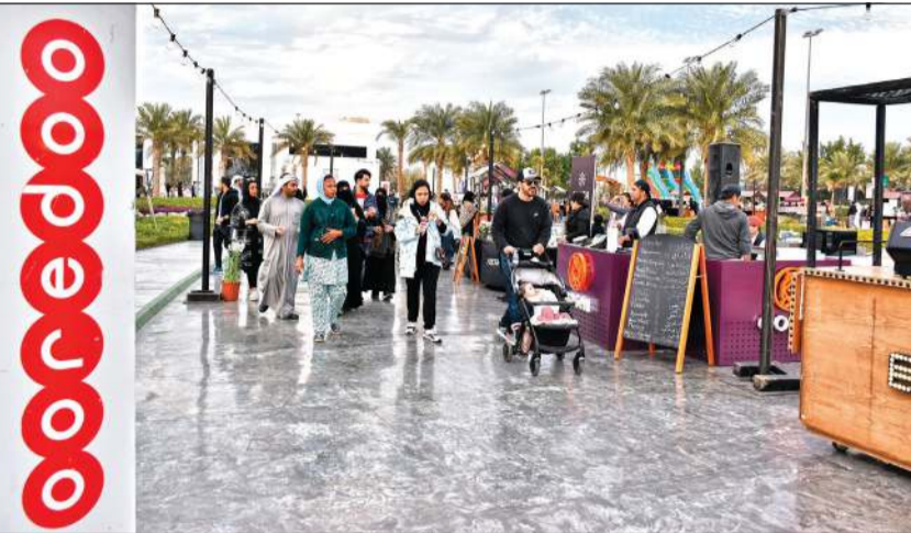
جانب من سوق Scene