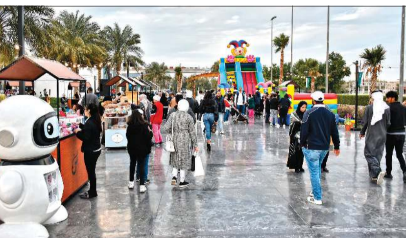
صورة لزوار السوق

أعلنت Ooredoo الكويت، أول شركة اتصالات تقدم الخدمات الرقمية المتكاملة في الكويت، عن دعمها لمشروع «Scene» الذي تم إنشاؤه بهدف دعم المشاريع الشبابية المحلية والشركات العالمية المميزة، وذلك بإعطائهم فرصة لعرض منتجاتهم وخدماتهم المتنوعة في السوق، والذي أقيم في مجمع مروج المرحلة الأولى، حيث ضم السوق المنتجات الغذائية والحرف اليدوية، بالإضافة إلى القسم المخصص للأطعمة الذي يسلط الضوء على تنوع الأطعمة المحلية.