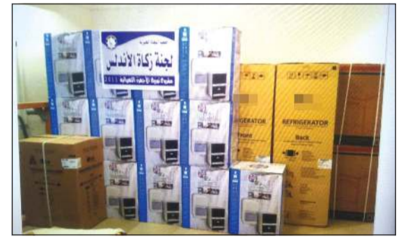
توزيع الأجهزة الكهربائية للمستفيدين