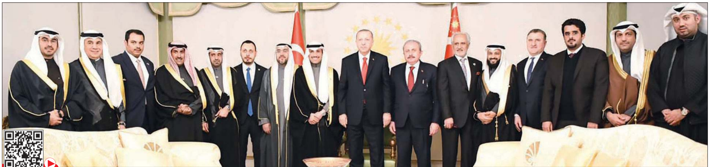
الرئيس التركي رجب طيب أردوغان خلال استقباله رئيس مجلس الأمة مرزوق الغانم والوفد المرافق له ويبدو النواب عبدالله فهاد وأسامة الشاهين ود.حمود الخضير وفراج العريبي وسفيرنا لدى أنقرة غسان الزواوي