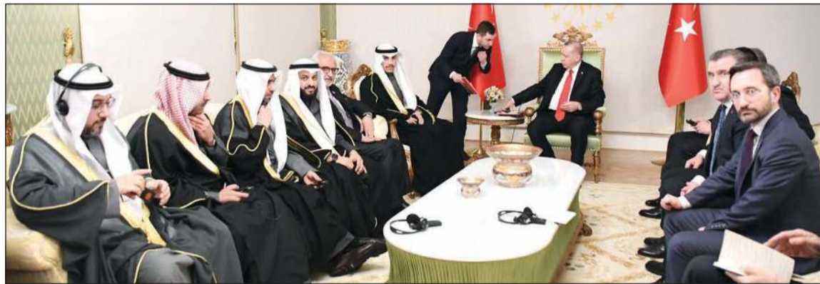
جانب من المباحثات الرسمية بين الجانبين