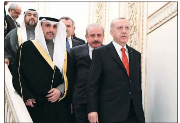
الرئيس أردوغان مع رئيس مجلس الأمة مرزوق الغانم

الغانم حرص الكويت على توثيق علاقات أكثر رسوخا وتكاملا مع تركيا. كما تطرق الغانم خلال اللقاء الى وضع استثمارات المواطنين الكويتيين في تركيا. مؤكدا أهمية مضي تركيا قدما في تقديم مزيد من التسهيلات للاستثمارات الكويتية وإزالة بعض التحديات والعراقيل التي واجهت المواطنين الكويتيين واستثماراتهم. وقد وعد الرئيس أردوغان بالعمل على تذليل كل