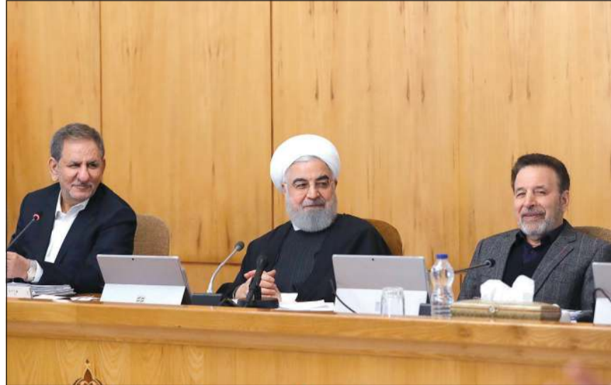
الرئيس الإيراني حسن روحاني مترشقا اجتماعا لمجلس الوزراء بطهران أمس (أ.ف.ب)

انني آسف لتكرار ما قلته سابقا، انه حينما باعت (ألمانيا وبريطانيا وفرنسا) بقايا الاتفاق النووي للحد من (زيادة) رسوم حكومة ترامب على السلع الأوروبية المستوردة، حذرت بأن هذا الامر سيجعله ترامب اكثر طمعا. بعد فقدان كل ركيزة وأساس أخلاقي وقانوني، جرى طرح تهديد آخر في مجال الرسوم. وأضاف ظريف: لقد كان من الأفضل لأوروبا ان تظهر أداء أفضل في مجال ممارسة السيادة. من جهة أخرى، أكد وزير الطرق الإيراني محمد إسلامي ان فك شفرة صندوق الطائفة الأوكرانية المنكوبة سيجري في إيران. ونقلت وكالة «فارس» الإيرانية عن إسلامي القول امس ان «العمل جار لإعداد المعدات والبرمجيات اللازمة لهذا الأمر». وكانت اللجنة الإيرانية المكلفة بالتحقيق في حادثة الطائفة الأوكرانية، التي تحطمت قرب طهران قبل أسبوعين، أعلنت مؤخرا أنها طلبت من فرنسا والولايات المتحدة تزويدها بالأجهزة اللازمة لفك شفرة صندوق الطائفة، إلا انها لم ترد.