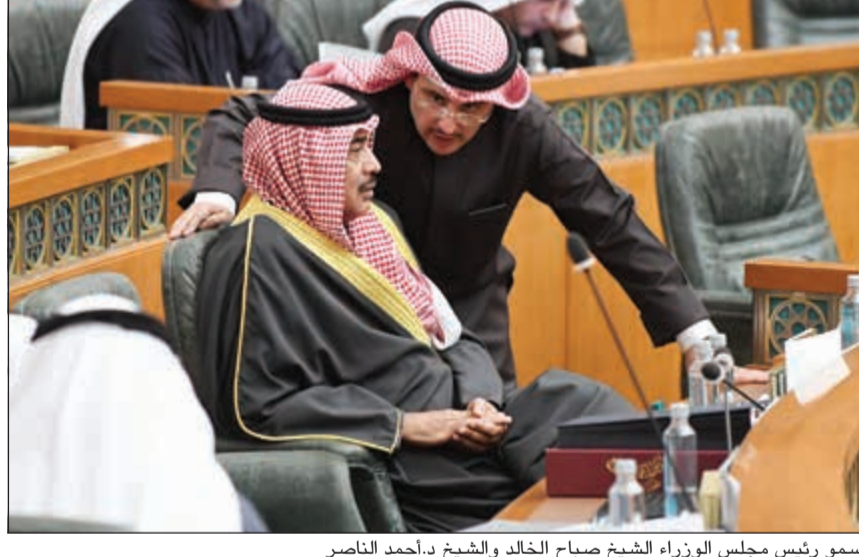
سمو رئيس مجلس الوزراء الشيخ صباح الخالد والشيخ د.أحمد الناصر