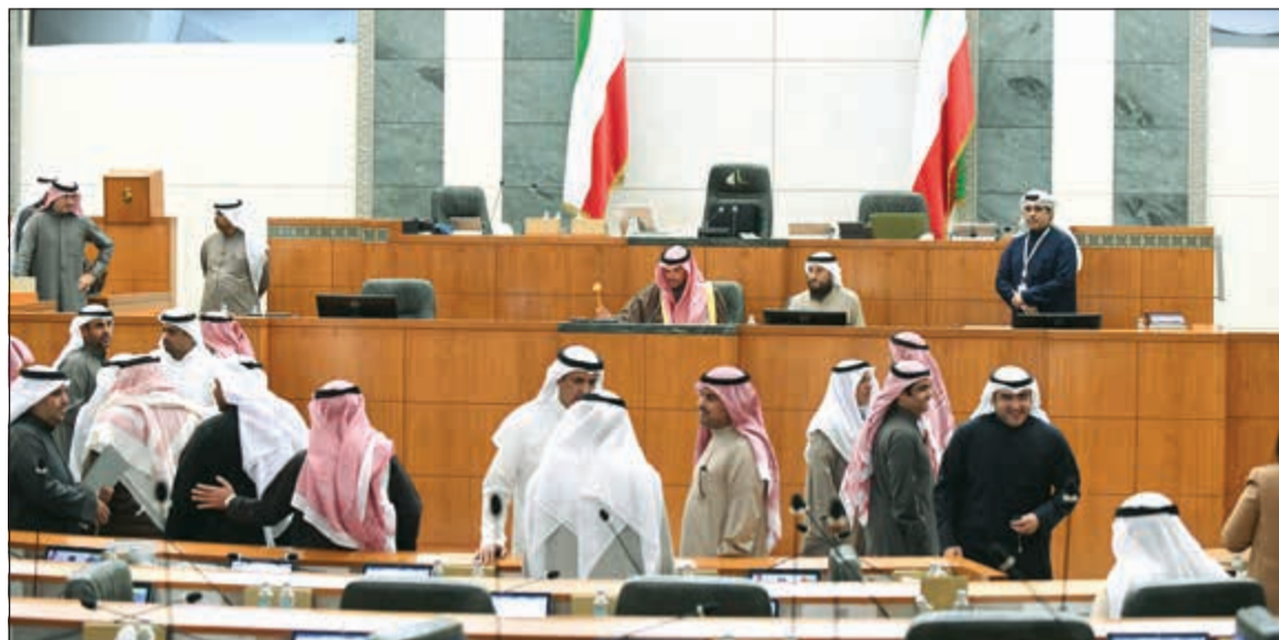
انتخابات الشعب البرلمانية