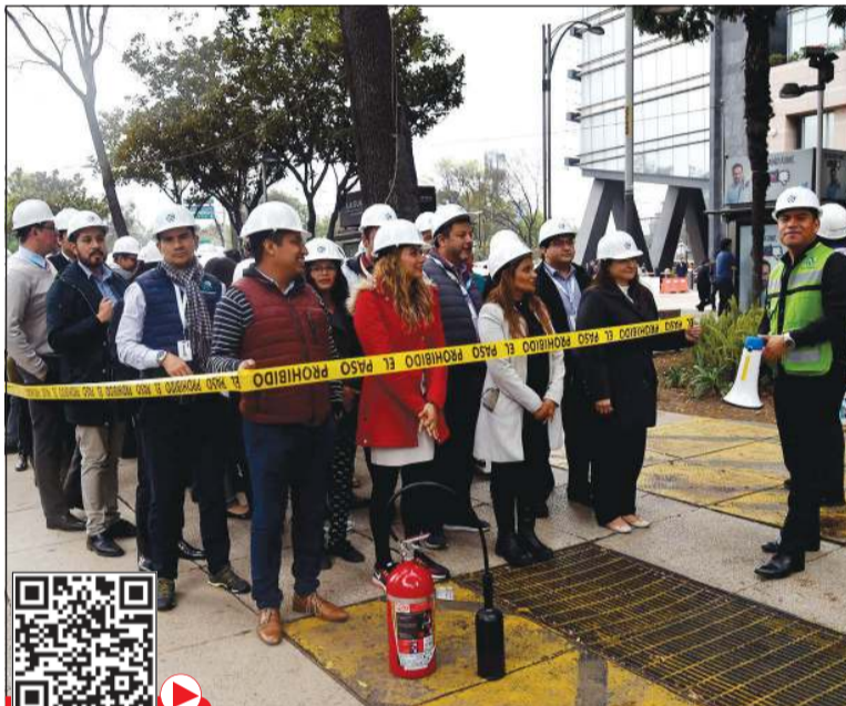
جانب من المشاركين في المناورة

مكسيكو - أ.ف.ب: شارك ملايين المكسيكيين في مناورة وطنية أجريت الاثنين للتدريب على مواجهة زلزال كبير قد يضرب البلاد المعرضة لهذا الخطر بشكل منتظم وفق ما أفادت السلطات المحلية. وأطلقت صفارات الإنذار عند الساعة الحادية عشرة صباحاً، لاختبار إجراءات الإخلاء في حال حدوث زلزال تتجاوز قوته 6 درجات على مقياس ريختر وفقاً للمصدر نفسه. وكان على الناس، خاصة المتواجدين في العاصمة التي تضم عدداً كبيراً من الأبراج، أن ينتقلوا إلى أماكن آمنة في أقل من دقيقة قبل الشعور بالهزات الأولى. في أحد الأبنية التي تضم مكاتب، قام رجال الإنقاذ بتجربة إخلاء المدنيين من النوافذ وهم معلقون بحبال، أما في الأبنية العامة مثل القصر الرئاسي أو المحكمة العليا، فقد أخذ كبار المسؤولين مكاتبهم وتجمعوا في مساحات محمية.