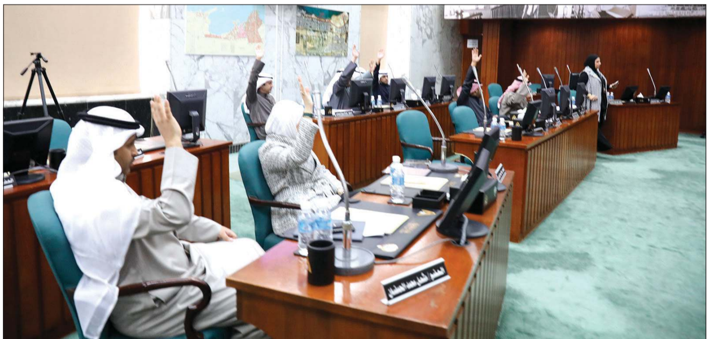
قرار تخصيص مواقع للمشاريع الصغيرة في مناطق التخييم غير نافذ