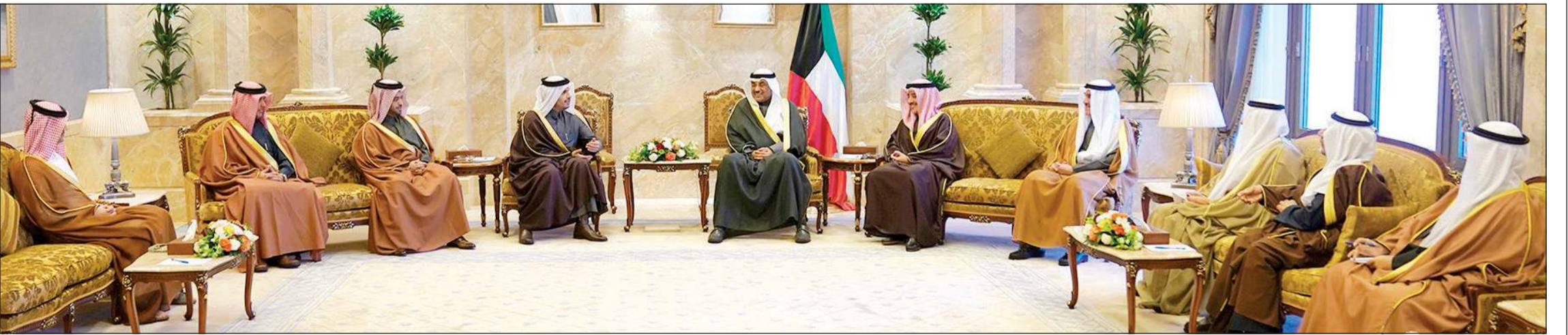
سمو الشيخ صباح الخالد خلال استقباله وزير خارجية قطر