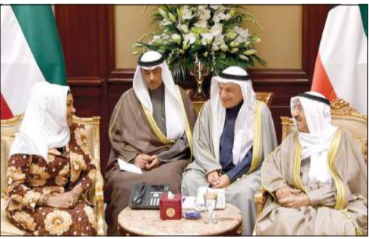
سمو الأمير مستقبلاً سفيراً لتانزانيا الاتحادية لدى الكويت

احتفل في قصر بيان صباح امس بتسليم صاحب السمو الأمير الشيخ صباح الأحمد أوراق اعتماد كل من السفيرة عائشة سالم امور سفيرة لجمهورية تنزانيا الاتحادية والسفير ماساتو تاكاوكا سفيرا لليابان والسفير سيد سجاد حيدر سفيرا لجمهورية باكستان الإسلامية وذلك كسفراء لبلادهم لدى الكويت. حضر مراسم الاحتفال وزير شؤون الديوان الأميري الشيخ علي الجراح ووزير الخارجية الشيخ د.احمد ناصر المحمد ونائب وزير شؤون الديوان الأميري والوكيل الديوان صاحب السمو الأمير أحمد فهد الفهد ورئيس المراسم والتشريفات الأميرية الشيخ خالد العبدالله.