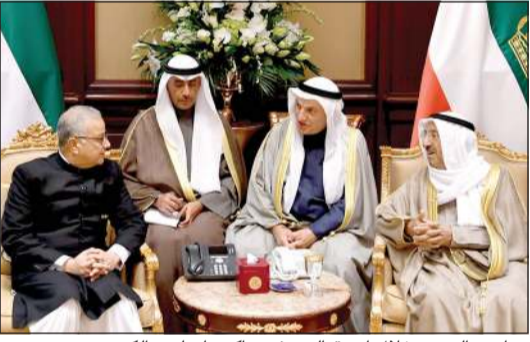
صاحب السمو خلال استقباله سفير باكستان لدى الكويت