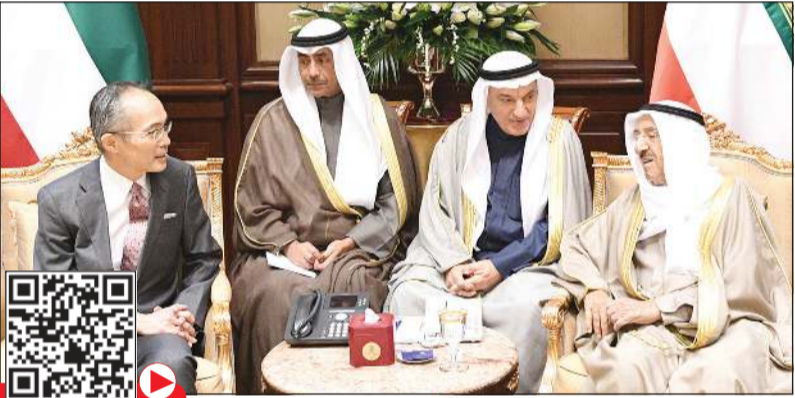
صاحب السمو مستقبلاً سفير اليابان لدى الكويت