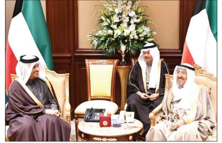
صاحب السمو مستقبلاً وزير الخارجية بدولة قطر

استقبل صاحب السمو الأمير الشيخ صباح الأحمد بقصر بيان امس نائب رئيس مجلس الوزراء ووزير الخارجية بدولة قطر الشقيقة الشيخ محمد بن عبدالرحمن بن جاسم آل ثاني وبحضور وزير الخارجية الشيخ د.احمد ناصر المحمد، حيث نقل لسموه رسالة شفهية من أخيه صاحب السمو الشيخ تميم بن حمد بن خليفة آل ثاني أمير دولة قطر الشقيقة تتعلق بالعلاقات الأخوية الراسخة التي تجمع البلدين والشعبين الشقيقين وسبل دعمها وتنميتها في جميع المجالات والقضايا ذات الاهتمام المشترك، كما نقل خلالها تمنياته لسموه بموقور الصحة والعافية ولشعب الكويت المزيد من التطور والنماء. هذا وقد حمله سموه تحياته وتقديره لأخيه صاحب السمو أمير دولة قطر الشقيقة وتمنيات