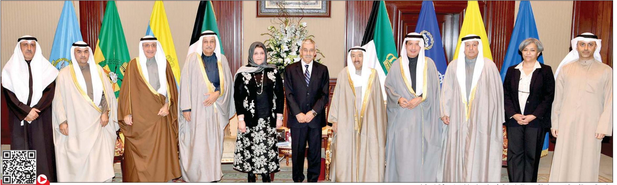
صاحب السمو الأمير الشيخ صباح الأحمد خلال استقباله أعضاء مجلس إدارة مؤسسة التقدم العلمي