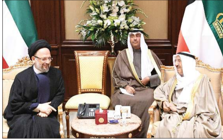
صاحب السمو خلال استقباله محمد حسين فضل الله

احتفل في قصر بيان صباح امس بتسليم صاحب السمو الأمير الشيخ صباح الأحمد أوراق اعتماد كل من السفيرة عائشة سالم امور سفيرة لجمهورية تنزانيا الاتحادية والسفير ماساتو تاكاوكا سفيرا لليابان والسفير سيد سجاد حيدر سفيرا لجمهورية باكستان الإسلامية وذلك كسفراء لبلادهم لدى الكويت. حضر مراسم الاحتفال وزير شؤون الديوان الأميري الشيخ علي الجراح ووزير الخارجية الشيخ د.احمد ناصر المحمد ونائب وزير شؤون الديوان الأميري والوكيل الديوان صاحب السمو الأمير أحمد فهد الفهد ورئيس المراسم والتشريفات الأميرية الشيخ خالد العبدالله.