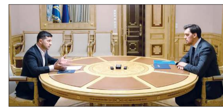
الرئيس الأوكراني فولوديمير زيلينسكي مستقبلاً رئيس الوزراء أوليكي غونشاروك أمس الأول (أ.ف.ب)

كييف - د.ب.أ: رفض الرئيس الأوكراني فولوديمير زيلينسكي طلب الاستقالة الذي تقدم به رئيس وزرائه الكيسي جونتشاروك. وقال الرئيس بعد لقائه برئيس الوزراء مساء أول من أمس، في كييف: «تدبر الأمر وبدلاً من الصواب أن تمنح أنت وحكومتك فرصة». وبهذا يظل رئيس الوزراء في منصبه بعد تصريحاته التي أثارت جدلاً كبيراً. وكان رئيس الوزراء قال قبل ذلك بساعات على موقع «فيسبوك» للتواصل الاجتماعي: «الإزالة أي شخصك حول تقديري وثقتي بالرئيس كتبت استقالتي ودمتها له». يأتي ذلك بعد أن أظهر مقطع صوتي لرئيس الوزراء (35 عاماً) يتحدث فيه بطريقة غير ملائمة عن الرئيس، حيث قال فيه إن الرئيس لديه تصور «بدائي للغاية» عن الاقتصاد وقدرة محدودة