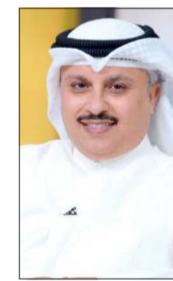
د. خليفة الهاجري

عام 2016، مشيرة إلى أن انضمام الفنانة أميرة يعد مكسباً كبيراً لنا بالإضافة إلى دخولها الهاجري الغني عن التعريف وهو شخصية أكاديمية معروفة على مستوى الوطن العربي، ويمكن القول بأن د. الهاجري أحد القامات القليلة المعروفة عربياً في مجال السينوغرافيا وهو يمتلك ثقافة وعمقا يتجاوزان تخصصه الأكاديمي، إذ إنه معروف بعلمه وثقافته المسرحية وقدرته على تقييم الأعمال المسرحية ونقدها.