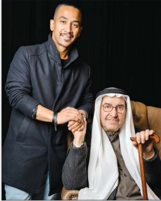
الكاتب الكبير عبدالعزيز السريع مع المخرج الشاب يوسف الحشاش