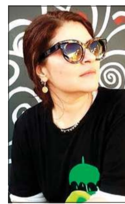
الفنانة التشكيلية أميرة بهباني