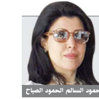
الشيخة حصة الحمود السالم الحمود الصباح

على وزيرتها بالخروج المبكر، فالأمر ليس له علاقة بقوة الاستجواب أو متانة محاوره أو غيره، الأمر متعلق بتوازنات سياسية داخل المجلس، والسياسة التي كانت تمارسه الحكومات السابقة، فسيكون من العسير على الحكومة عبور الاستجواب مهما كان سطحيا أو تشوبه عدم الدستورية أو بسيطا، فدخلت الحكومة بصدرها مفتوح دون وجود تحالفات نيابية، وهذا ما عقد صفقات ستكون قد حكمت