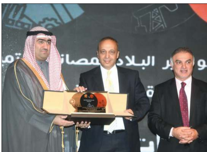
..ومكرما الشركة الكويتية للاغذية (امريكانا)