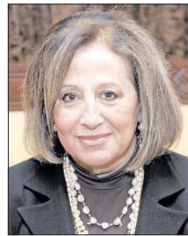
الكتيبة عواطف البدر