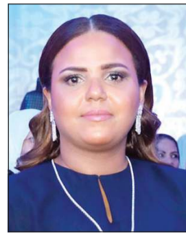
الشيخة ريم راشد الحمود