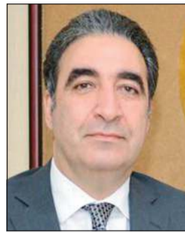
السفير ايلخان قهرمان