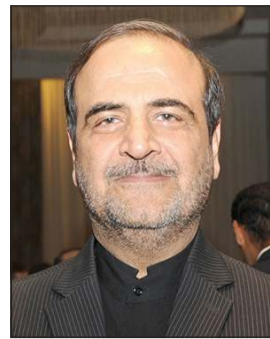
السفير محمد ايراني