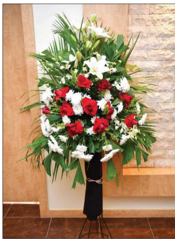
زهور عواطف البدر زينت «الأنباء» في عيدها الـ 44 (فريال حماد)

كما لا ننسى وقوف «الأنباء» الى جانب الشباب ودعم مبادراتهم ومشروعاتهم وانشطتهم في مختلف المجالات الطلابية والرياضية والاقتصادية والثقافية وذلك انطلاقا من حرصها على انجاحها ولباز جهود اصحابها. ودعاؤنا لكم بالتوفيق الدائم والنجاح المستمر لتبقى جريدة «الأنباء» نبرسا للحق ومبرا للكلمة الحرة. وتقبلوا فائق التقدير والاحترام.