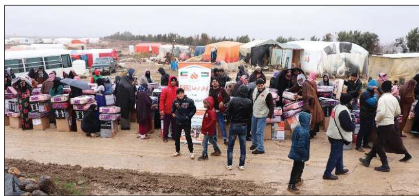
قافلة المساعدات الإنسانية

أضعف من أن تصمد في وجه الرياح العاتية والأمطار الغزيرة لذا كانت الحاجة ملحة الى استمرار القوافل الإغاثية التي تسيرها جمعية الرحمة العالمية. وأعرب السويلم عن خالص