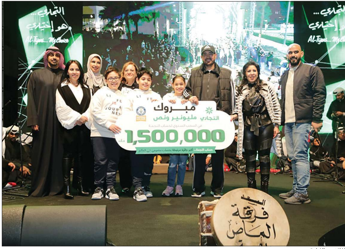
الفائز مع الإدارة