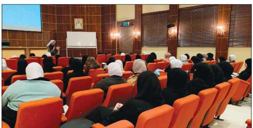
جانب من المشاركات في الدورة