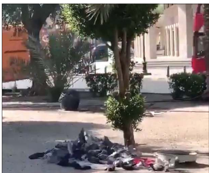
الحمام قبل تحميله داخل سيارة المواطن