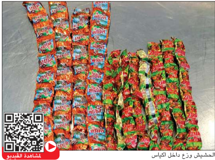
الحشيش وزع داخل اكياس