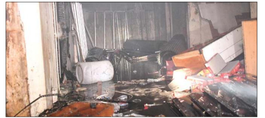
الحريق خلف تلفيات مادية

في سوق المباركية. وقال مصدر في «الإطفاء» إن مساحة الحريق بلغت 250 مترا واقتصرت خسائره على مادية دون إصابات تذكر، وفتح تحقيق للوقوف على أسباب الحريق.