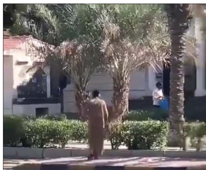
المواطن يتجه إلى جمع الحمام من داخل الشبكة

المقطع تم تحديد هوية المتهم من خلال لوحة مركبته ومن ثم جرى التواصل معه واستدعاؤه للتحقيق، وهناك يعرف لماذا فعل المواطن ذلك، وهناك شخص بوضع شبك في مكان يتردد عليه الحمام بكثافة في العاصمة. وقال مصدر أمني: فور تداول