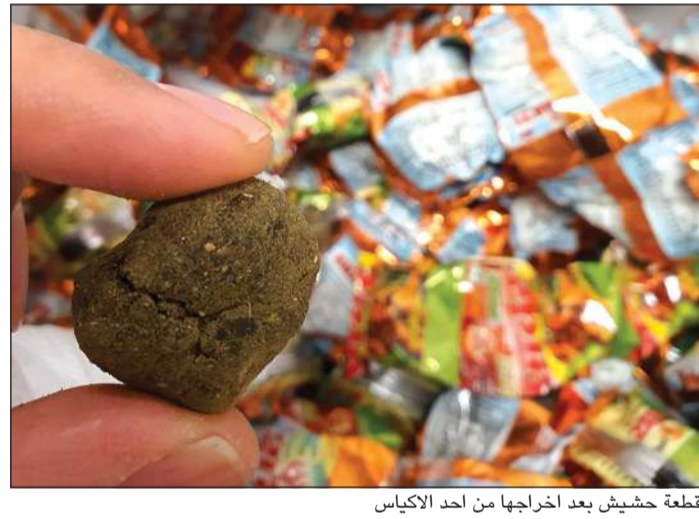
قطعة حشيش بعد اخراجها من احد الاكياس

الخطوط الأرضية، وعند الاقتراب من قائدها لتحرير مخالفة مرورية بحقه اتضح أنه شاب عشريني ليس بحوزته إثبات وأنه بحالة غير طبيعية، وعند تفتيش المركبة احترق احتراقا عذرا بداخلها على كيس يحتوي على مواد مخدرة، وتمت إحالته والمضبوطات إلى الجهة المختصة.