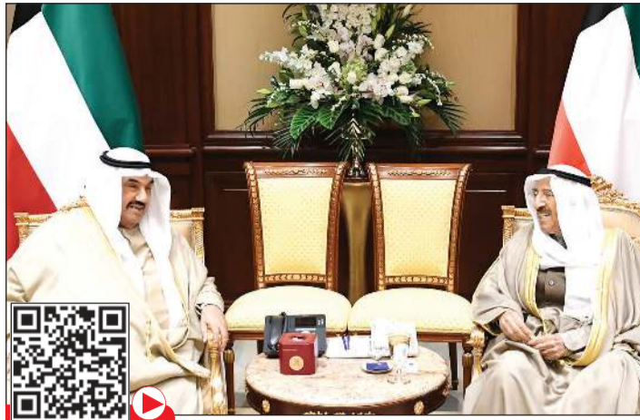
صاحب السمو الأمير الشيخ صباح الأحمد مستقبلاً سمو الشيخ ناصر المحمد

بحث رئيس جهاز الأمن الوطني الشيخ ثامر العلي الصباح أمس مع سفير المملكة المتحدة لدى الكويت مايكل دافنبورت المواضيع ذات الاهتمام المشترك. وقال جهاز الأمن الوطني في بيان صحفي إن اللقاء بين الطرفين استعرض أوجه التعاون وبحث العلاقات الثنائية التي تجمع بين البلدين وسبل تعزيزها وتطويرها، كما تم بحث أهم القضايا المشتركة التي تهم البلدين على الساحتين الإقليمية والدولية.