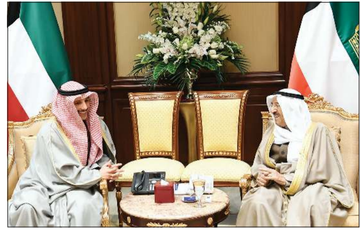
صاحب السمو الأمير الشيخ صباح الأحمد مستقبلاً رئيس مجلس الأمة مرزوق الغانم