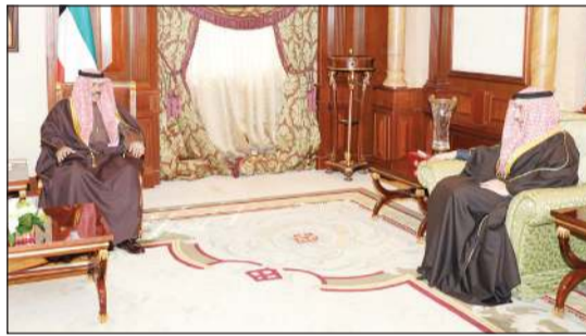
سمو ولي العهد مستقبلاً الشيخ د. أحمد ناصر المحمد

قدم لسموه الشيخ مشعل الجابر العبدالله محافظ الفروانية وذلك بمناسبة عيد الفصحى في منصبه الجديد. كما استقبل سمو ولي العهد الشيخ نواف الأحمد بقصر سموه بقرية المنصور. واستقبل سموه بقرية المنصور. واستقبل سموه بقرية المنصور. واستقبل سموه بقرية المنصور.