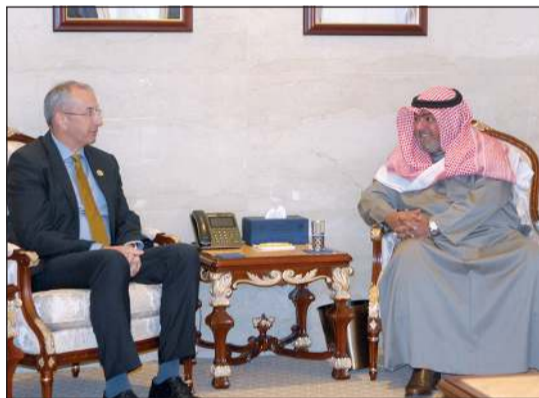
الشيخ ثامر العلي مستقبلاً السفير مايكل دافنبورت

بحث رئيس جهاز الأمن الوطني الشيخ ثامر العلي الصباح أمس مع سفير المملكة المتحدة لدى الكويت مايكل دافنبورت المواضيع ذات الاهتمام المشترك. وقال جهاز الأمن الوطني في بيان صحفي إن اللقاء بين الطرفين استعرض أوجه التعاون وبحث العلاقات الثنائية التي تجمع بين البلدين وسبل تعزيزها وتطويرها، كما تم بحث أهم القضايا المشتركة التي تهم البلدين على الساحتين الإقليمية والدولية.