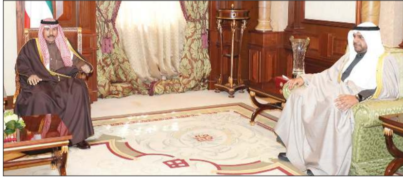
سمو ولي العهد الشيخ نواف الأحمد مستقبلاً الشيخ أحمد المنصور