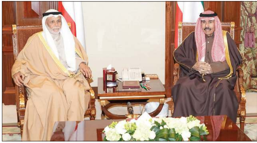
سمو ولي العهد الشيخ نواف الأحمد مستقبلاً المستشار يوسف المطاوعة