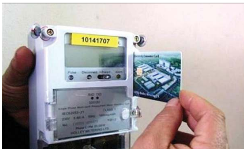
صورة أرشيفية للعداد المسبق الدفع

كشفت وزارة الكهرباء والطاقة المتجددة د.محمد شاكر عن مساعي الوزارة لانتهاء من قراءة العدادات بطريقة «القراءة الموحد» بنظام التصوير بنهاية العام الحالي، مؤكداً أن نظام «القراءة الموحد» هو إحدى آليات الوزارة للقضاء على مشاكل فواتير الكهرباء الناتجة عن أخطاء القراءات. جاء ذلك خلال رد وزير الكهرباء، امس على عدد من طلبات الإحاطة بلجنة الطاقة والبيئة بمجلس النواب، برئاسة م. طلعت السويدي.