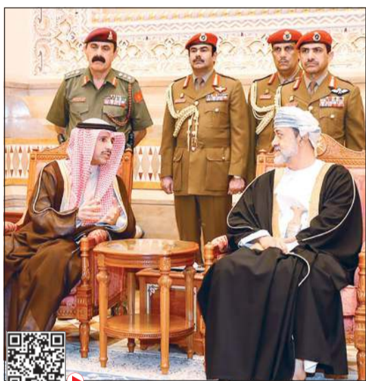
الرئيس مرزوق الغانم يقدم واجب العزاء للسلطان ميثم بن طارق