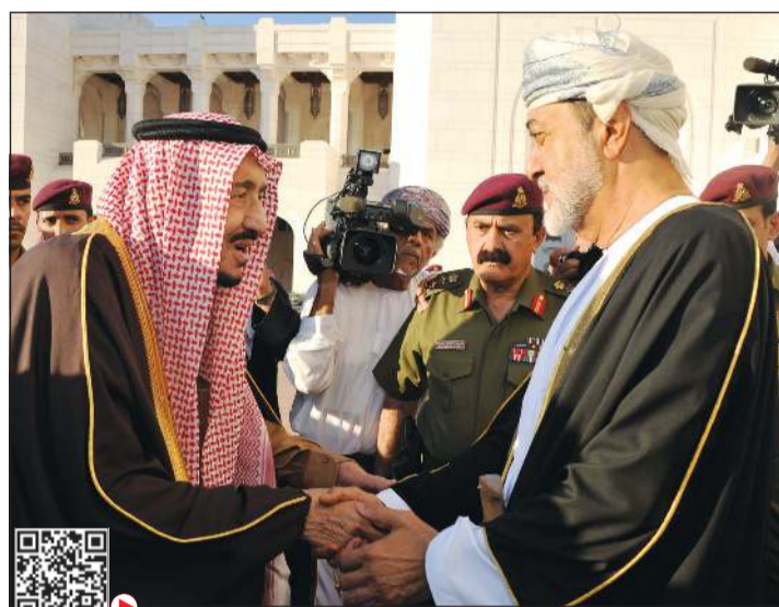
خادم الحرمين الشريفين الملك سلمان بن عبدالعزيز يعزي السلطان ميثم بن طارق