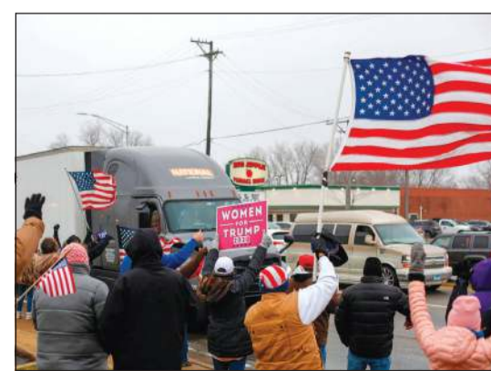
مؤيدون لترامب خلال مظاهرة تطالب بإعادة انتخابه في البينوي أمس الأول

الاحتجاجات في ميدان «أزادي» بالعاصمة ووجود برك من الدماء على الأرض وصور لمصابين، وفقاً لمقاطع فيديو نشرت على مواقع التواصل الاجتماعي. من جهتها، نفت الحكومة الإيرانية أي إطلاق نار من قبل