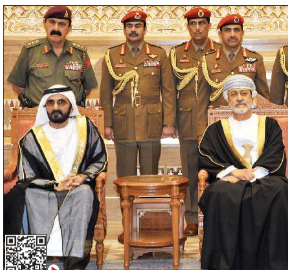
صاحب السمو الشيخ محمد بن راشد معزيا السلطان ميثم بن طارق