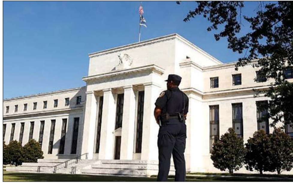
مبنى الاحتياطي الفيدرالي