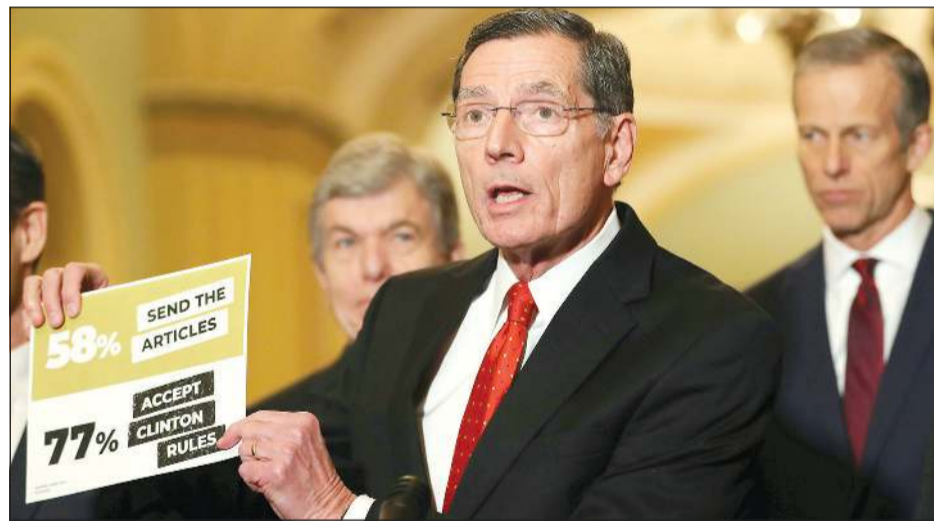
زعيم الجمهوريين في «الشيوخ» ميتش ماكونل خلال مؤتمر صحافي في الكابيتول أمس الاول

وتحدث شومر الجمهوريين علما أنه يحتاج فقط إلى مخالفة أربعة أعضاء جمهوريين لقرار الحزب من أجل تمرير قاعدة في المحكمة تسمح بمثول الشهود. وتساءل شومر «هل سيتمسكون بتقديم الأدلة أم سيشاركون في (عملية) تستر؟».