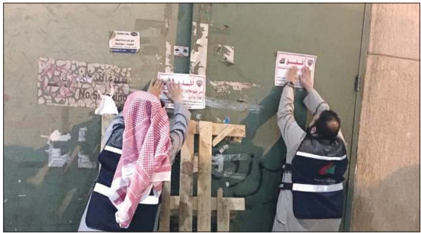
إغلاق أحد المحلات المخالفة

أعلنت وزارة التجارة والصناعة، اليوم، إغلاق 25 محلاً تجارياً لمخالفتها القوانين المعمول بها وعدم التزامها بالنظم واللوائح، مؤكدة أنها لن تتواني في تطبيق القوانين وإيقاع الجزاءات بحق المخالفين. وأوضحت «التجارة» في بيان صحافي أن الإغلاقات شملت شركتين للتجارة العامة و4 مطاعم، و3 محلات هدايا وكماليات ومحلا لبيع اللحوم وبقالة و3 محلات لبيع الملابس الجاهزة والأحذية و8 محلات لبيع الخضار والفواكه وفرع الأعلاف ومحلا للدكوير وكراج سيارات. وذكرت أن عملية الإغلاق جاءت بعد تكثيف التحريات والبحث في أنشطة تلك المحال، حيث تأكدت «التجارة» من صحة