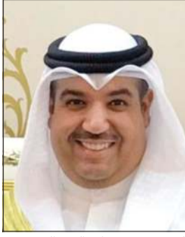
الشيخ مشعل جابر العبد الله

وللمحافظ الجديد إنجازاته عبر مشاريع عديدة ناجحة في إدارته الداخلية، أبرزها: ● تطوير قواعد البيانات الوطنية لدى وزارة الداخلية وفق أعلى المعايير والمقاييس العالمية. ● إنشاء وتطوير الموقع الاحتياطي للحاسب الرئيسي (Main Frame) بوزارة الداخلية. ● تطوير موقع وزارة