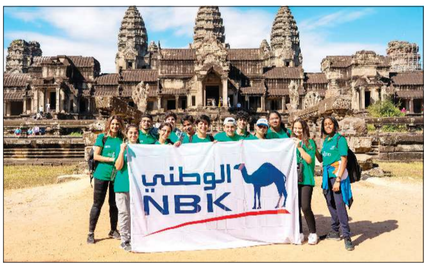
متطوعو «لويك» خلال رحلتهم إلى كمبوديا

شارك بنك الكويت الوطني في رحلة مؤسسة لويك التطوعية إلى كمبوديا، وذلك بمشاركة نحو 12 متطوعاً من الفئة العمرية ما بين 14 و18 عاماً، وتأتي هذه الرحلة في إطار رعاية بنك الكويت الوطني المستمرة لفعاليات وأنشطة مؤسسة لويك، والتزاماً من البنك بمسؤوليته الاجتماعية تجاه الكوادر الوطنية الشابة. وتخللت الرحلة مجموعة من الفعاليات والأنشطة الهادفة إلى التعرف على الثقافة المحلية من خلال العمل الميداني، إلى جانب الزيارات إلى المعالم الحيوية والحضارية في كمبوديا. وقد تضمنت الرحلة برنامجاً ثقافياً متنوعاً شمل زيارة عدة مدن مثل بنوم بنه وميونغ تشام وسيام ريب وعدداً من المراكز الاجتماعية. وتأتي هذه المبادرة بهدف تعزيز التفاعل الاجتماعي