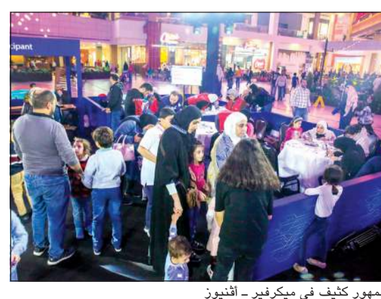
جمهور كثيف في ميكرفير - أفنيوز