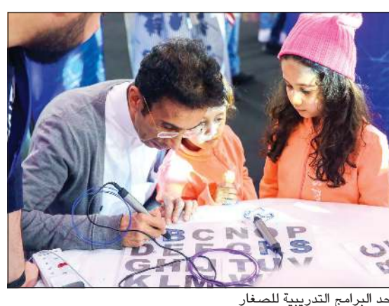
أحد البرامج التدريبية للصغار

اختتمت الشركة الكويتية للاستثمار، نسختها المصغرة من معرض «ميكرفير - أفنيوز» من 2 إلى 4 يناير الجاري بمجمع الأفنيوز. وأوضحت الشركة في بيان أن إقامة هذه الفعالية، بالتعاون مع شركة المباني، تهدف إلى تسويق معرض الصناعة العالمي «ميكرفير - كويت 2020» المقرر إقامته في الفترة من 11 إلى 15 فبراير المقبل، لدى زوار الأفنيوز، وذلك لمنح المزيد من الزخم وتبسيط الضوء بشكل مكثف