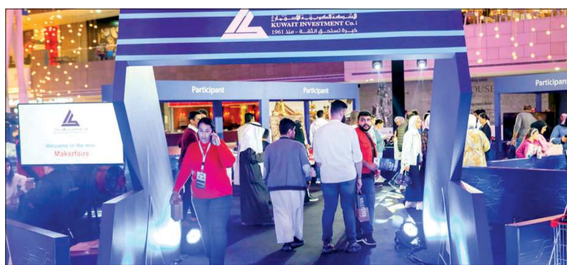
ميكرفير - أفنيوز

بفكرة التواجد في المجمع الأكبر في البلاد، فقد يكون هناك البعض ممن لا يعرفون كثيرا عن معرض ميكرفير-كويت، وعلق آخرون على أن معرض الصناعة الذي تقيمه الكويتية للاستثمار فرصة جيدة لاستغلال الطاقات الكامنة داخل المؤسسات من الروبوت، تركيب القطع الخشبية، وتخلل ذلك برامج تدريبية للصغار. وأضافت الشركة أن ثلاثة مشاريع فائزة في معرض الصناعة العالمي ميكرفير كويت في النسخة الثالثة الماضية، وتواجدت في نسخة الأفنيوز وذلك لإطلاع الجمهور على ثمرات نجاح «ميكرفير كويت»، والمشاريع هي: تشكيل المجسمات الحبة من السيلكون، حرف خشبية، فن تشكيلي ثلاثي الأبعاد، وخلال انعقاد النسخة المصغرة للأفنيوز، أبدى عدد من الزوار إعجابهم الشديد