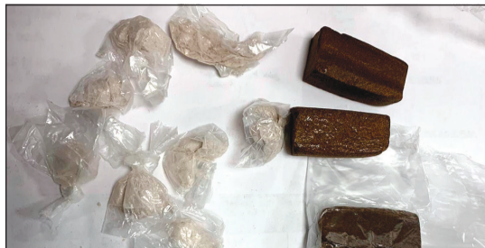
المنوعات في حوزة رجال الجمارك