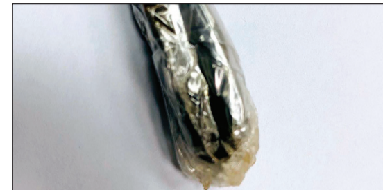
قطعة الحشيش التي تم العثور عليها