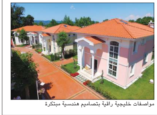
مواصفات خليجية راقية بتصاميم هندسية مبتكرة

المشروع يطل على بحيرة صنبجة وتحتضنه الطبيعة.. وتوقعات بارتفاع الأسعار بعد الانتهاء من «التلفريك» 09