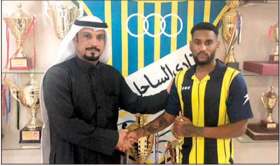
الفضلي مع محترف الساحل الفرنسي فرانك براغا