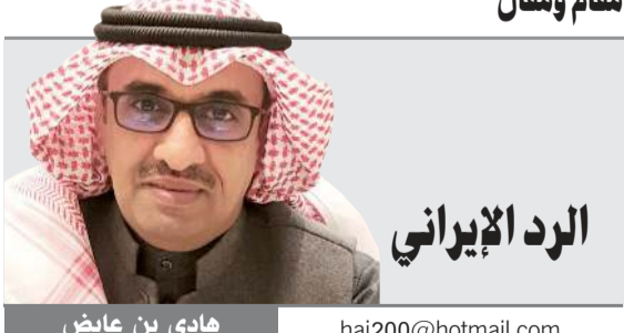
هادي بن عايض

تدخل أميركي يحمي سفارتها ووقف المظاهرات، إلا أن العقيلة الأميركية كانت بعيدة كل البعد عن ذلك بعد أن وصلت النيران إلى سفارتها بأبواب تشاركها العمل في منطقة الأمان، ليكون الرد الأميركي برسالة أكثر حرما وإيلاما من خلال استهداف الأشخاص الذين قد يكون لهم القرار في مثل هذه الأحداث ولقطع الطريق أمام أي قرارات أخرى متشابهة. لذلك قرر الرئيس الأميركي ترامب قتل سليماني والمهندس ليحقق أكثر من هدف داخليا وخارجيا ويعزز بذلك حظوظه في الفوز بالانتخابات المقبلة وإعادة ترتيب العلاقات داخل العراق وهو ما حصل بالفعل.