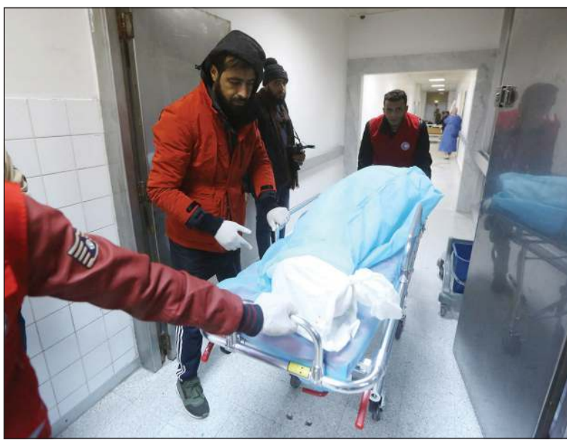
نقل احد ضحايا الهجوم على الكلية العسكرية في طرابلس