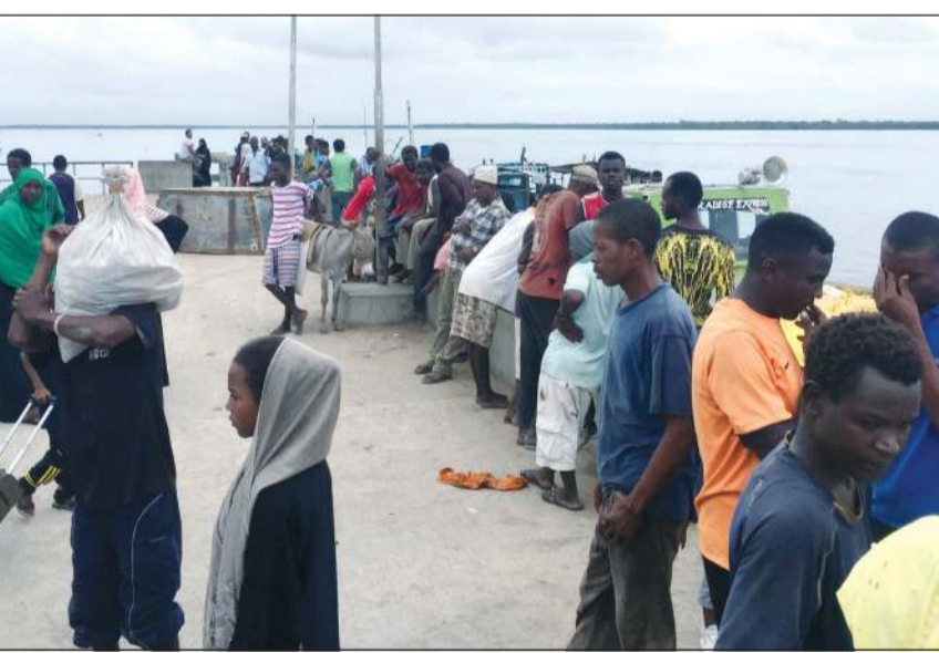
تجمع للمساافرين بالقرب من القاعدة العسكرية الأميركية في كينيا

وكفنت الولايات المتحدة منذ أبريل 2017 هجماتها الجوية في الصومال منذ أن وافق الرئيس دونالد ترامب على توسيع قدرات الجيش الأميركي في إطلاق عمليات لمكافحة الإرهاب، ميدانياً أو جواً.