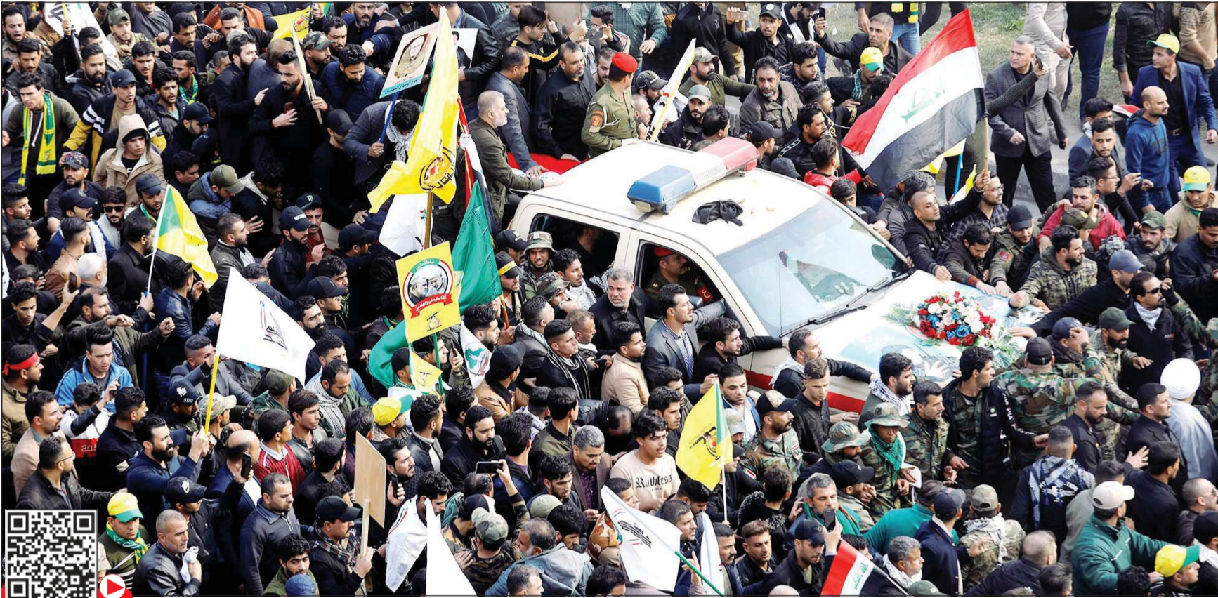
جانب من تشييع جثمانى سليمانى والمهندس في بغداد أمس

وعلى صعيد الداخل الأميركي، أعلن رئيس بلدية نيويورك بيل دي بلاسيو أن مسؤولي الأمن في المدينة رفعوا درجة تأهب أجهزةهم تحسباً لأي انتقام إيراني.