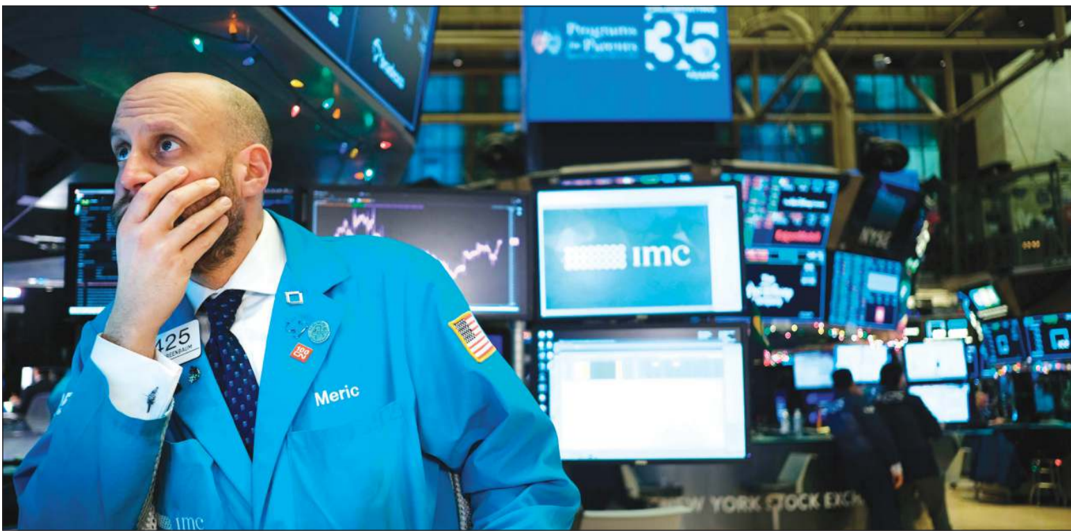
انخفاض أسعار الأسهم العالمية بعد الضربة الجوية الأميركية في العراق.. ويبدو في الصورة متداول في بورصة نيويورك للأوراق المالية

وقفزت أسعار الذهب نهاية تداولات الأسبوع إلى أعلى مستوياتها في 4 أشهر واخترقت حاجز 1550 دولاراً للأوقية (الأونصة) بعد مقتل سليمانى وهو ما أثار موجة شراء في الأصول الآمنة. وصعد المعدن الأصفر في المعاملات الفورية 1,2٪ إلى 1546,68 دولاراً للأوقية في أواخر جلسة التداول بعدما سجل في وقت سابق من الجلسة 1553,20 دولاراً، وهو أعلى مستوى له منذ الخامس من سبتمبر.