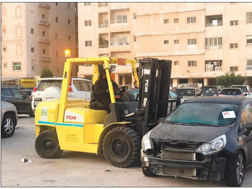
رفع إحدى السيارات المهمة

وفي سياق آخر، قام مركز تنمية التابع لإدارة النظافة العامة وإشغالات الطرق برفع بلدية محافظة الجھراء بحملة على السيارات المهمة والمعروضة للبيع، حيث أسفرت الحملة عن رفع 4 سيارات مهمة ووضع 15 ملصقا، وسيتم رفعهم بعد الانتهاء من المدة القانونية. وحملت «خلها نظيفة».