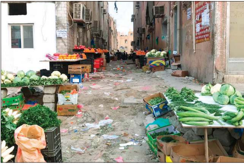
جانب من الأسواق العشوائية في الجليب