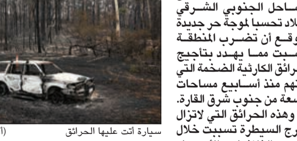
سيارة أتت عليها الحرائق

سيدني - وكالات: وجهت السلطات الأسترالية أمس بالإخلاء القسري لبعض السكان فيما فر آلاف السياح من المناطق الواقعة على الساحل الجنوبي الشرقي للبلاد تحسبا لموجة حر جديدة يتوقع أن تضرب المنطقة السبت مما يهدد بتأجيل الحرائق الكارثية الضخمة التي تلتهم منذ أسابيع مساحات واسعة من جنوب شرق القارة، وهذه الحرائق التي لاتزال خارج السيطرة تسببت خلال يومي الثلاثاء والأربعاء بمقتل 8 أشخاص على الأقل ومحاصرة العديد من السياح. من جهتها: أعلنت رئيسة وزراء ولاية نيو ساوث ويلز غلاديس بيريكلان الخميس حالة الطوارئ لمدة 7 أيام للسماح بالإجلاء القسري ابتداء من الجمعة. وهذه هي