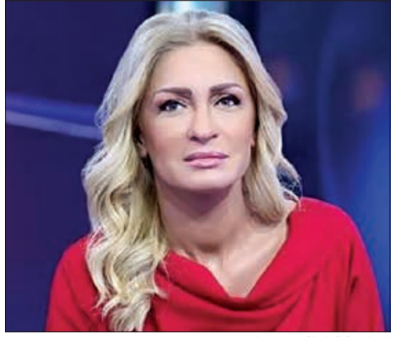
الإعلامية الراحلة نجوى قاسم

دبي - أ.ف.ب: توفيت الإعلامية اللبنانية البارزة نجوى قاسم التي تعد من أشهر مذيعات الأخبار في العالم العربي أمس الخميس عن 52 عاما في دبي، على ما أعلنت شبكة «العربية» حيث تعمل. ونعت قناة «العربية» و«العربية الحدث» في بيان صحافي قاسم «التي وافتها المنية صباح (أمس) الخميس في منزلها في دبي» حيث تقيم بمفردها. ولم يات البيان على ذكر سبب وفاة المذيعة الشهيرة. وكانت قاسم من أبرز الوجوه الإعلامية في العالم العربي. وقد انضمت إلى شبكة «العربية» مع انطلاقها في العام 2003، كما أنها تعمل منذ سنوات عدة في قناة «العربية الحدث». وقبل انضمامها إلى «العربية» عملت نجوى قاسم اعتبارا من التسعينيات