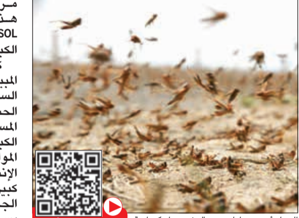
الجراد أصبح ساما بسبب الرش بمواد كيميائية

مرض SOL. وفي الحقيقة هذا المرض يسمى Liver Metastasis SOL، الذي يتلف الكبد ويميت الإنسان. كما ذكرت في السابق إن المبيدات الحشرية الكيميائية السامة الموجودة في جسم الحشرة أو عليها هي من أحد مسببات المرتبطة بتليف الكبد، حيث تنسب هذه المواد الكيميائية في جسم الإنسان وهناك احتمالية كبيرة في أنها تسبب سرطان الجهاز الهضمي المرتبط بسرطان الكبد على المدى البعيد. وأخذ من مس هذه الحشرة لأن ما تحمله من ترسبات كيميائية على القشرة والهيكلي الخارجي قد يكون خطرا. ولم يربى الجراد أوجه رسالة صحية بأن يمتنعوا عن أكل الجراد نيتا وأن يلتزموا بطبخه أولا بالماء الحار لقتل جميع الميكروبات المرضية والتخلص كذلك من الرجل والأجنحة والرأس قبل الأكل فهي من أخطر أجزاء جسم الحشرة التي تنقل الميكروبات بشكل كبير وذلك تبعاً لأبحاثي العلمية.