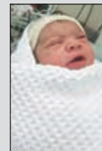
المولودة الثانية بمستشفى الولادة