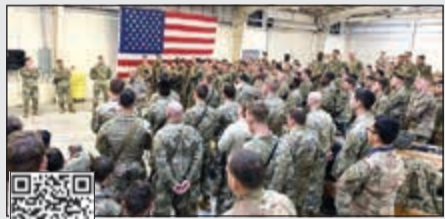
عناصر من كتيبة المشاة المظليين الأمريكية أثناء استعدادها للتوجه إلى الكويت

500 جندي أمريكي إلى العراق عبر الكويت وواشنطن وطهران تواصلان السجال 18