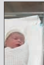
من أوائل مواليد 2020